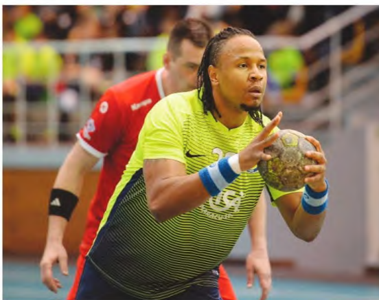
Madeira SAD venceu no Funchal o Fermentões de forma clara.