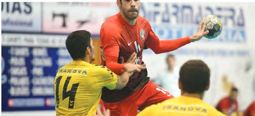
Madeira Andebol SAD somou mais três pontos na sua caminhada no Nacional da I Divisão.

Claramente superior conjunto comandado por Paulo Fidalgo aproveitou esta partida frente ao último classificado, desde logo para dar tempo de competição a elementos menos utilizados, mas sobretudo para fazer crescer o grupo ainda mais. A pensar claramente no futu-