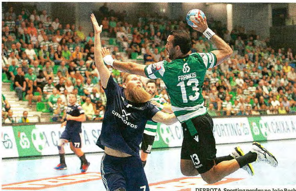
DERROTA. Sporting perdeu no João Rocha