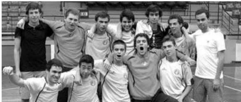
Madeira Andebol SAD conquistou o título em juvenis.

Nas emoções da final de juvenis masculinos o Madeira Andebol SAD foi mais forte que o Académico e conquistou o ouro por 27-25. Já nos iniciados/juvenis femininos o Madeira SAD bateu na final a AD Camacha por 14-13. O prémio para melhor pivot foi entregue a Guilherme Nascimento (Académico) e Sandra Gonçalves (AD Camacha). P. V. L.