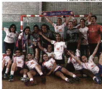
Equipa fez história no clube de Tavira