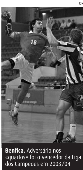
Benfica. Adversário nos «quartos» foi o vencedor da Liga dos Campeões em 2003/04

Na ronda anterior, o HC Celje Pivovarna afastou os dinamarqueses do Aarhus Haandbold, com duas vitórias, por 22-23 (fora) e 26-24 (casa), enquanto o Benfica eliminou os romenos do Energia Pandurii Targu, igualmente com