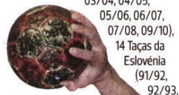
David Tavares já conhece rivais dos 'quartos'

Palmarés: 1 Liga dos Campeões (03/04), 1 Troféu dos Campeões (03/04), 7 vezes semifinalista da Liga dos Campeões, 1 vez semifinalista da Taça das Taças (02/03), 17 presenças na Taça/Liga dos Campeões; 17 campeonatos da Eslovénia (91/92, 92/93, 93/94, 94/95, 95/96, 96/97, 97/98, 98/99, 99/00, 00/01, 02/03, 03/04, 04/05, 05/06, 06/07, 07/08, 09/10), 14 Taças da Eslovénia (91/92, 92/93, 93/94, 94/95, 95/96, 96/97, 97/98, 98/99, 99/00, 00/01, 03/04, 05/06, 06/07, 09/10).