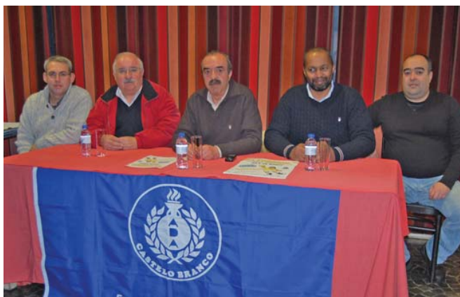
Responsáveis da ADA promovem andebol jovem