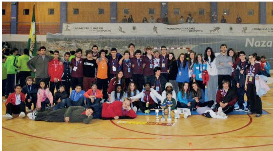
Grupo do S. Bernardo que participou no Torneio Internacional da Nazaré

A formação de Juvenis Femininos teve um desempenho notável, atendendo a que as restantes quatro equipas - Asso-mada, Benfica e Castelo Branco, Colégio de Gaia e Dom Fuas - tinham todas melhor “ranking”