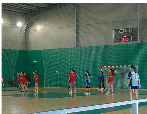
Competição durante todo o fim de semana

A organização fez questão de convidar algumas das maiores referências do andebol feminino português, como são os casos das formações do Colégio de Gaia, Maiastars, Almeida Garret, Lusitanos ADA Canelas ou o Santa Joana.