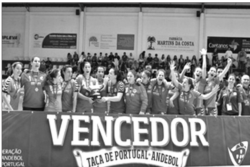
Equipa do Madeira SAD conquistou no domingo a 16.ª Taça de Portugal de andebol.