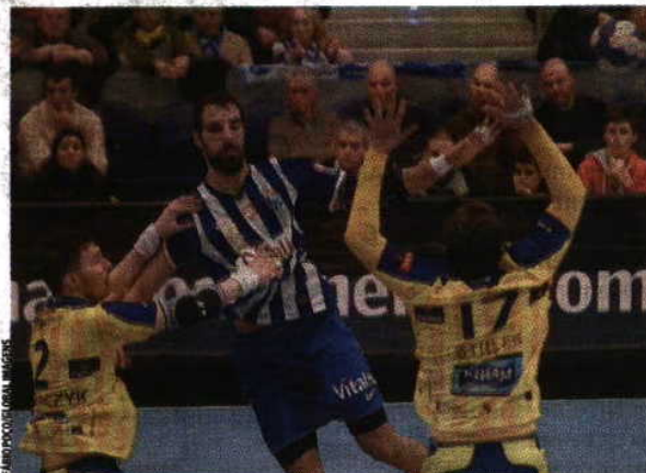
Força João Ferraz não teme os franceses e quer vencer

Queremos ganhar e, se o conseguirmos, não ficamos em último. Sabíamos que podíamos ter feito mais, mas não foi fácil, principalmente no último jogo, em que nos batemos com uma grande equipa. A nível geral, batemo-nos bem e agora queremos a terceira vitória." Os dragões despedem-se da Europa no dia 19, com a deslocação à Alemanha, onde medem forças com o Kiel. A formação portuguesa tem quatro pontos, graças a vitórias caseiras frente a Dunquerque e Kolding.