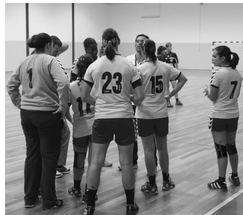
EQUIPA de andebol da Juve viaja amanhã para a Turquia

Recorde-se que a Juve Lis já afastou uma equipa inglesa, uma grega e uma letã. O próximo adversário é uma incógnita para uma Juve Lis que no campeonato ocupa o quarto lugar atrás do Madeira SAD, Gil Eanes e Colégio João de Barros. |