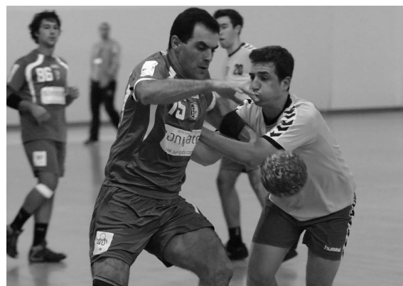
AC SISMARIA mostrou pouca eficácia na linha dos sete metros

com a Juve Lis a deslocar-se ao pavilhão da Gândara, num jogo onde os da casa são claramente favoritos. I