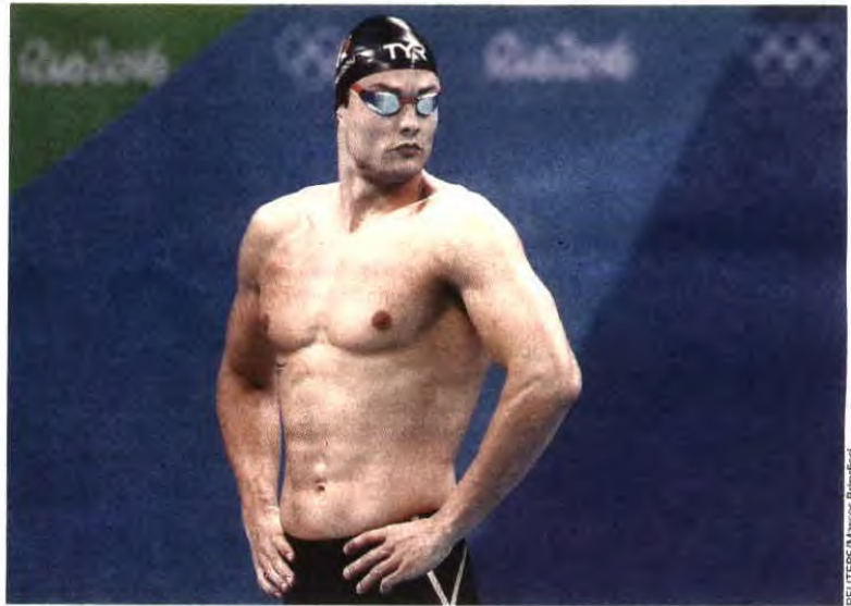
Manaudou vai pôr os seus 1,99 metros e 101 quilos ao serviço do Aix-en-Provence

Michael Jordan, pelo mediatismo e palmarés, será um dos casos de maior notoriedade, mas a verdade é que a mudança do basquetebol, depois de três títulos na NBA, para o basebol, em 1993, não