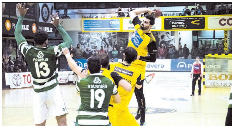
ABC/UMinho e Sporting tiveram duelos muito interessantes na temporada passada