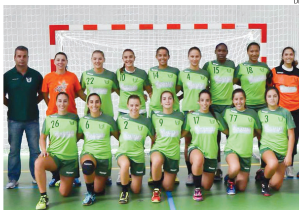
SIR/CJB é candidato aos primeiros lugares da classificação

A Marinha Grande teve oportunidade de presenciar a primeira exibição da SIR 1º de Maio/CJB, equipa que surge este ano no panorama nacional