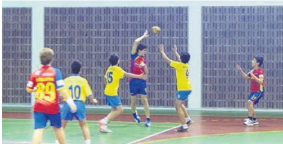
Arsenal da Devesa continua a pautar classe na sua época de estreia no andebol nacional