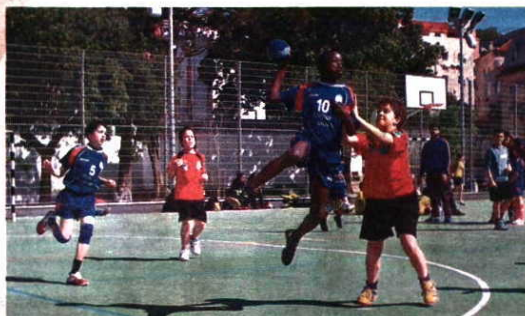
VIRTUDE. Passos Manuel tem a missão de formar jovens