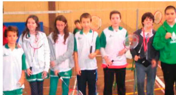
Badminton da Escola do Caniço.