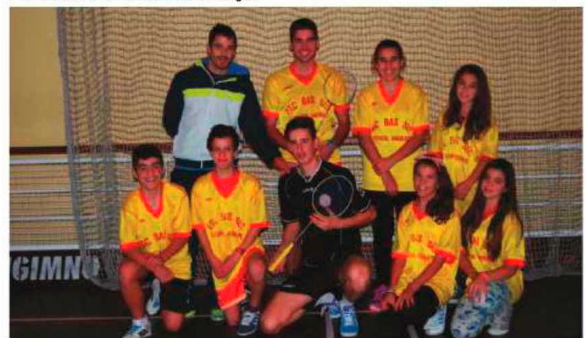
Escola de São Vicente.