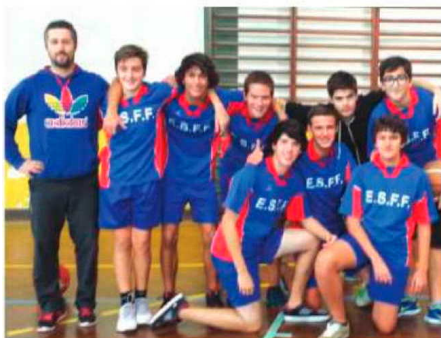
Basquetebolistas juvenis da Francisco Franco.