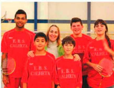
Badminton da Escola da Calheta.