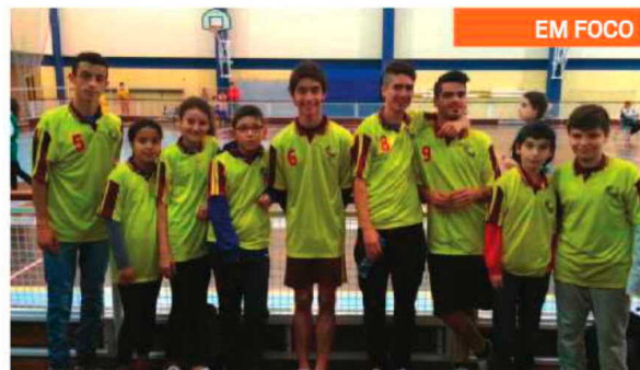
Representantes da Escola do Carmo.

No badminton decorreram várias Concentrações, em diferentes escalões, juntando mais de 100 alunos.