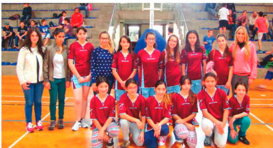
Basquetebolistas Infantis e Iniciados de São Jorge.

No passado sábado foram diversas as actividades desenvolvidas pela Direcção de Serviços do Desporto Escolar.