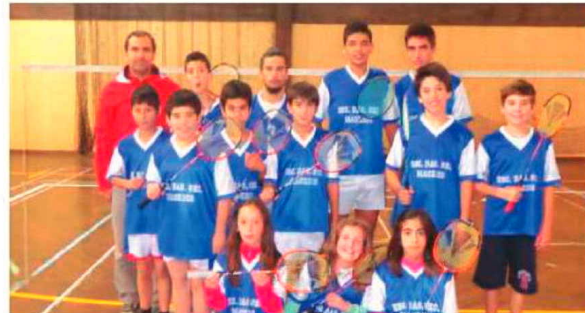
Jovens da Escola de Machico.