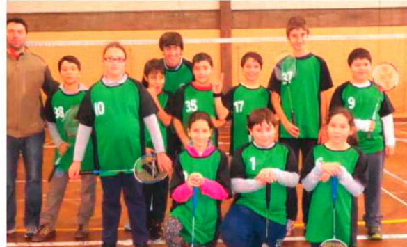
Badminton da Escola de Santa Cruz.