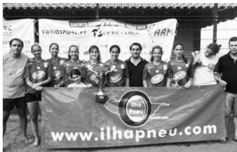
Em femininos o Marítimo venceu as três etapas do circuito.