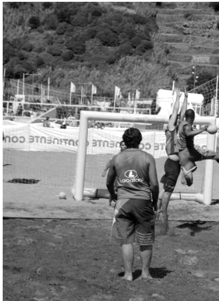
TORNEIO está marcado para sábado no areal grande da Praia da Vitória

Relembre-se, a propósito, que o Sporting Clube da Horta compete ao mais alto nível há vários anos, sendo mesmo uma das referências da modalidade de andebol. ❏