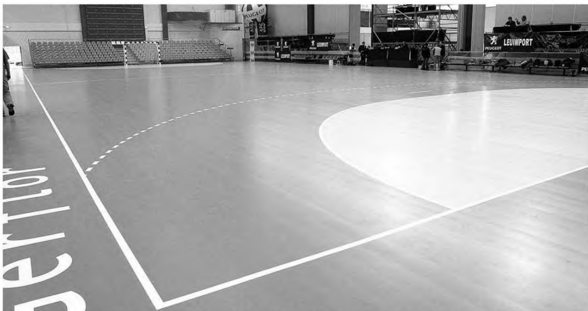
Sintético que foi colocado no Madeira Tecnopolo em 2003 vai ser instalado no Pavilhão do Funchal.