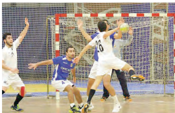
Académica foi derrotada em casa pelo Benavente

A turma estudantil fez uma primeira parte de grande nível na qual esteve quase sempre em vantagem, fraquejando apenas no final, terminando com um parcial de 20-21. Num jogo com muitos golos, onde os ataques superiorizaram as organizações defensivas, os estudantes desperdiçaram mais