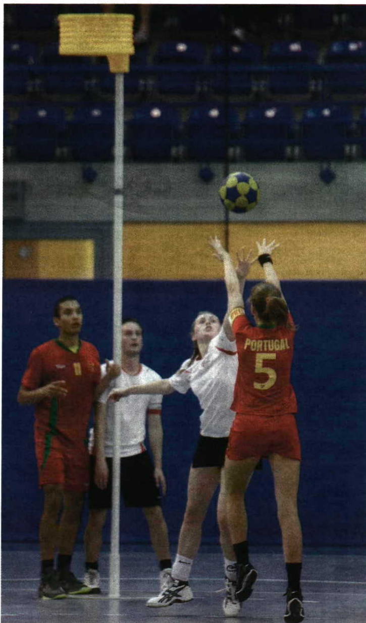
Misto Mulheres e homens jogam juntos, mas marcações só se fazem ao próprio sexo

Fundado em 1902, na Holanda, o único país em que é profissional, o corfebol foi implementado em Portugal há 30 anos e tem 521 praticantes, sendo que 320 são federados. "Há muitas modalidades em Portugal que têm tantos federados como nós, mas a diferença é que têm medalhas olímpicas. Se fosse para eu definir o corfebol, diria o seguinte: somos pequeninos, mas somos os