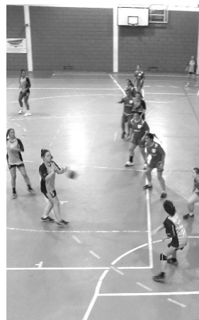
S.Félix segue imparável

vitória folgada da equipa gaiense, a exibição algo apagada do S.Félix impediu que a diferença no resultado fosse ainda maior, dada a grande discrepância de qualidade entre as duas formações. Com mais este