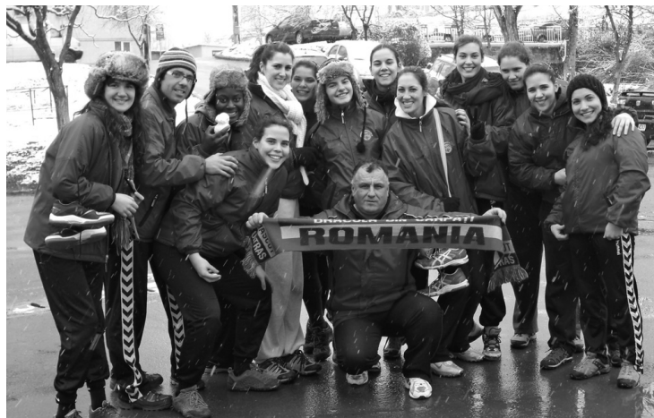
JOGOS nas competições europeias vão proporcionando maior experiência às jogadoras leirienses

O técnico acrescentou ainda que o primeiro jogo acabou por surpreender já que a diferença no marcador foi de apenas nove golos. "Há uma diferença muito grande entre as equipas. Elas são profissionais, treinam duas vezes por dia, e são remuneradas. Uma realidade muito diferente da nossa. Por isso, anormal foi o resultado da primeira mão (25-14). Já no jogo da