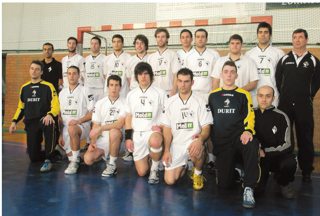
ARTÍSTICA DE AVANCA esteve muito perto de alcançar a vitória na fase final do campeonato

Fenomenal actuação dos locais, que mereciam outro desfecho do jogo. A vitória "fugiu" a dois segundos do final do encontro