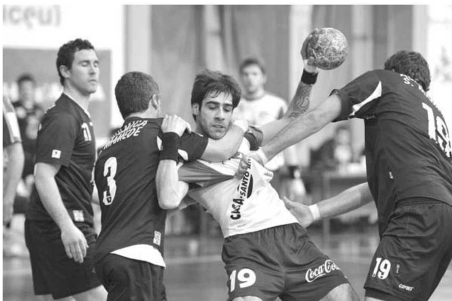
O Madeira Andebol SAD já pensa na fase final do campeonato nacional da I Divisão.