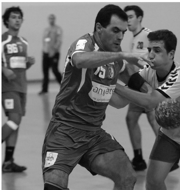
SISMARIA sentiu mais dificuldades do que o previsto contra o Avanca