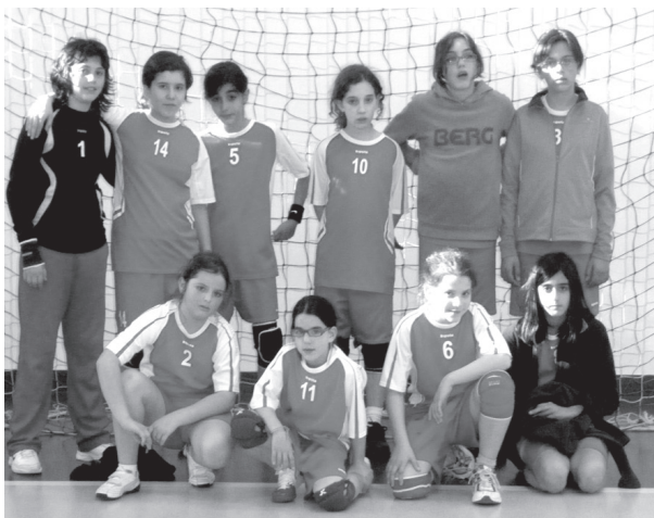
A equipa de infantis femininos

Benfica, iniciou pela primeira vez, a participação no campeonato de andebol de cinco da