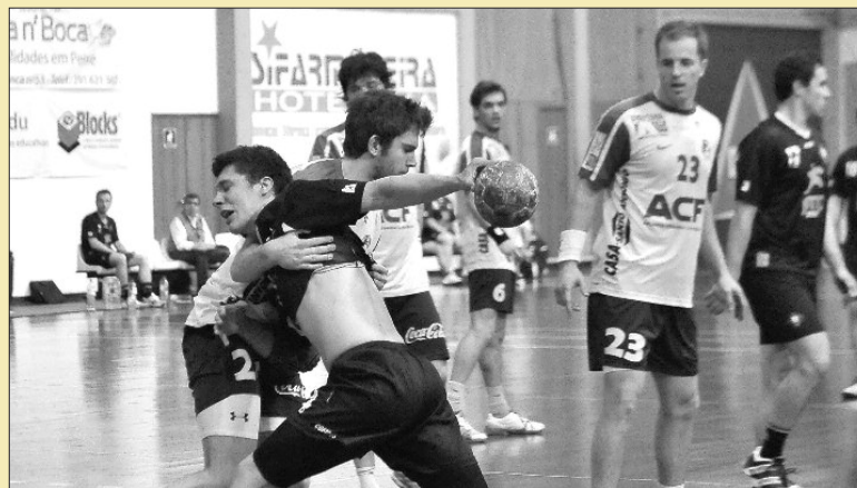
No Funchal, os madeirenses justificaram o seu favoritismo diante dos nortenhos.

Tarefa cumprida. O Madeira SAD (4.º à entrada da 21.ª jornada) derrotou, como se esperava, a Académica de São Mamede (9.ª), ontem à noite, no Funchal, por 29-22 e deu mais um passo para ficar num dos três primeiros lugares da 1.ª Divisão masculina de Andebol. Os nortenhos vieram à Região para complicar a tarefa