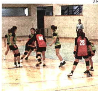
Três anos depois o regresso da Juve Lis

→ Juve Lis está de regresso às provas europeias e inaugura novo pavilhão na cidade do Lis