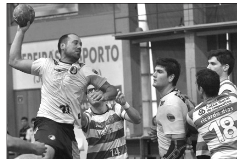
"Sociedade" não tem confirmada presença no jogo frente aos "leões".

sendo certo, até ontem, que a equipa orientada por Donner possa comparecer em Odivelas. Recorde-se que para o Campeonato, o Sporting obteve duas vitórias dilatadas diante dos insulares: 34-25 no Funchal e 38-25 em Lisboa, este último jogo realizado a 9 de Fevereiro. Nesta altura, após 21 jornadas, o Sporting é 3.º, com 50 pontos, e o Madeira SAD 6.º, com 43. Falta apenas uma jornada