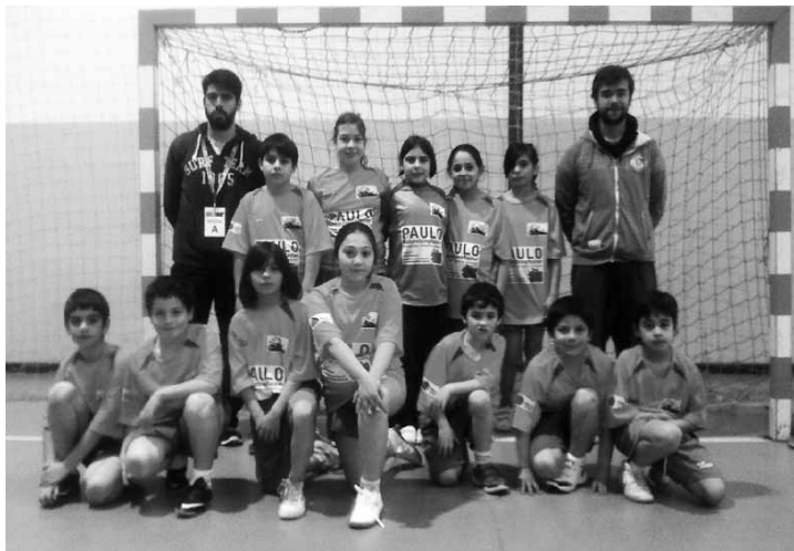
Apesar do resultado, o empate teve sabor a vitória para todos os atletas

Foi também nesse mesmo dia que teve início, neste ano letivo, o