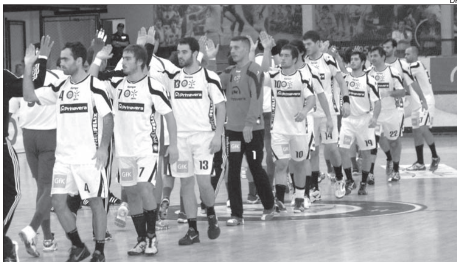
ABC pede o apoio do público no jogo com o FC Porto