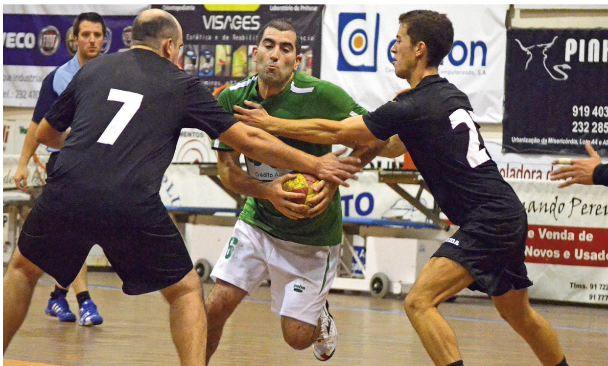
RU DA CRUZ

Clubes de Viseu acusam associação – que organiza a série que integram, no Nacional da 3.ª Divisão - de muitas “arbitrariedades”, o que levou equipas aveirenses aos dois lugares da subida, à entrada para a última ronda