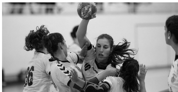
EQUIPAS de Leiria são candidatas a lutar pelo título nacional