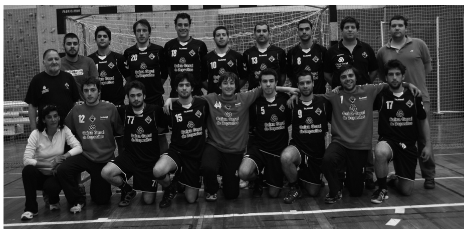
A ACADÉMICA continua invicta na Fase de Apuramento

Foi em Tondela que os estudantes reforçaram a liderança, com um triunfo suado que os deixa a um empate de garantir o 1.º lugar da Fase de Apuramento