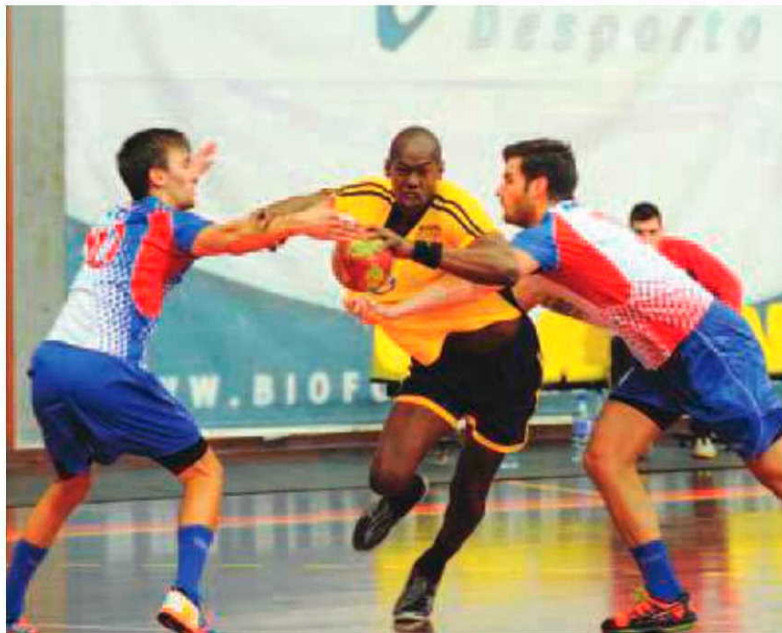
Madeirenses averbaram nova vitória fora de casa.