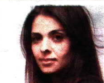
Cuca Roseta Fadista