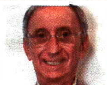
Júlio Isidro Apresentador