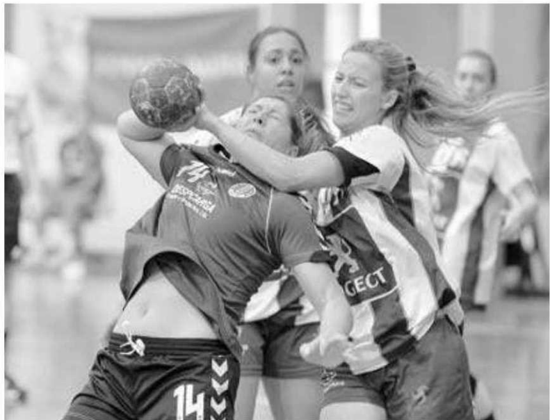
O Madeira SAD e Sports estão na fase final da prova.

Desde logo numa prova onde claramente existem quatro candidatos ao título, o Madeira SAD re-