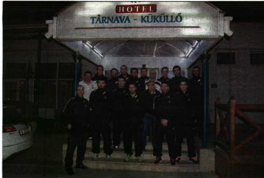
Cansados - Equipa do Águas Santas já em Odorhei, após 19 horas de viagem