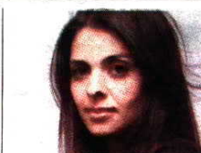
Cuca Roseta Fadista