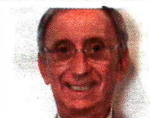
Júlio Isidro Apresentador