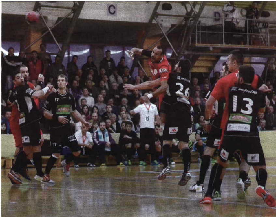
Combatividade - Águas Santas teve de mexer na defesa para não deixar fugir os romenos