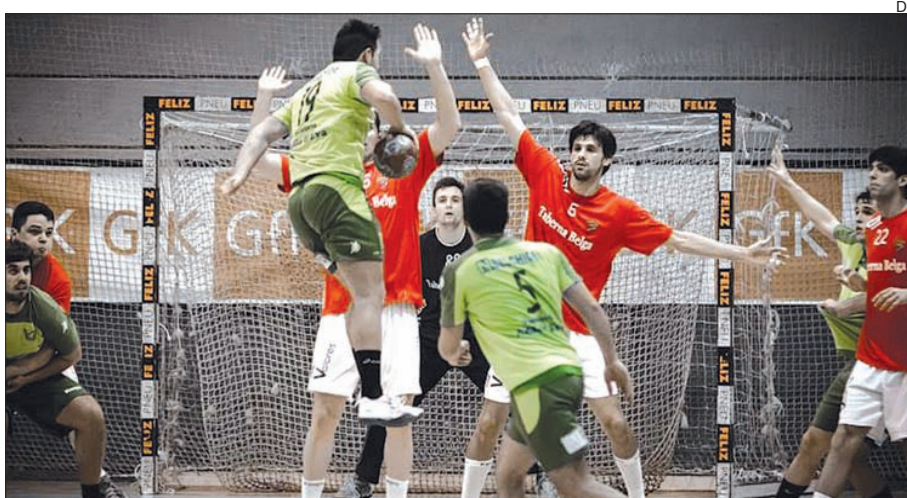
Arsenal da Devesa conta por vitórias os três jogos realizados na zona Norte da III Divisão

O Arsenal da Devesa após duas deslocações nas duas primeiras jornadas,