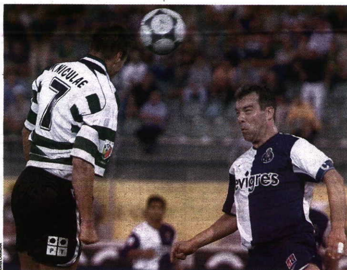
Campeão - O Sporting de 2001/02 foi o último a terminar à frente do FC Porto

Um cenário que contrasta notoriamente com o que acontecia no período pré-Pinto da Costa. Primeiro campeão de Portugal, em 1934/35, o FC Porto acabaria por somar apenas mais seis títulos nacionais até 1982, contra os 24 do Benfica e os 16 do Sporting. O pe-