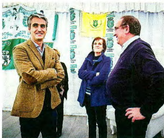
Nuno Pinto Fernandes/Global Images