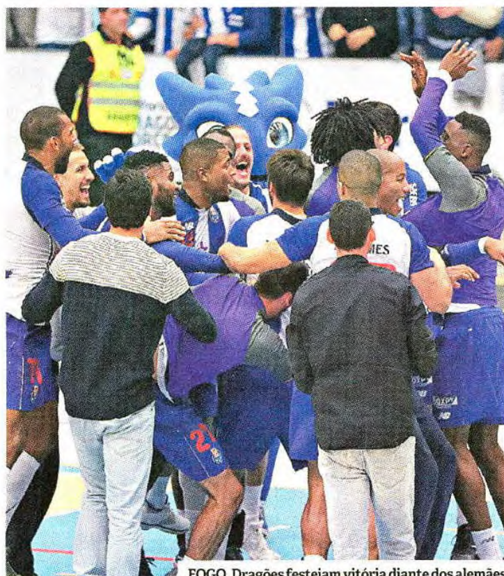
FOGO. Dragões festejam vitória diante dos alemães

A turma de Magnus Andersson até entrou algo precipitada no encontro e acumulou erros ofensivos, mas o técnico sueco foi astuto