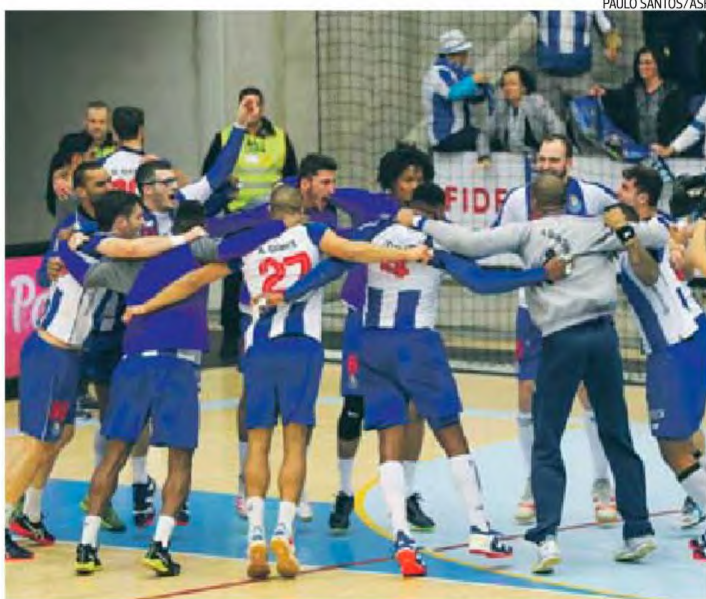
Jogadores do FC Porto celebraram a vitória e a passagem à fase de grupos da Taça EHF