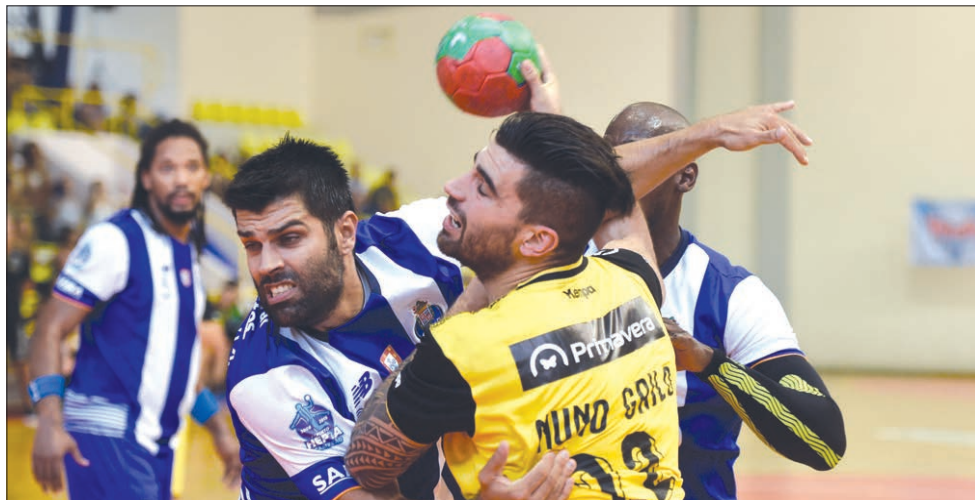
ABC/UMinho averbou segunda derrota caseira esta temporada, totalizando quatro