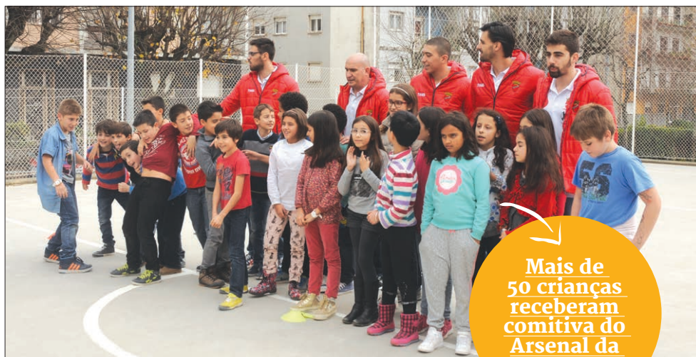
Estudantes de São Lázaro numa tarde diferente com os andebolistas