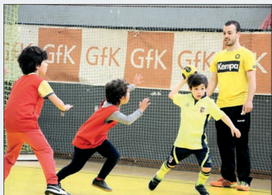
Mais novos aprenderam com os craques do ABC/UMinho

Os elementos ligados ao ABC/UMinho distribuíram lembranças aos participantes.