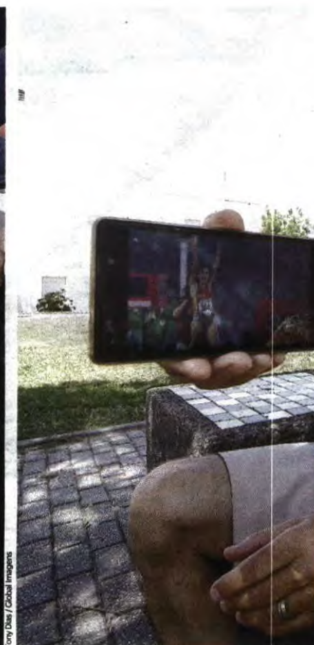
Tony Dias / Global Images