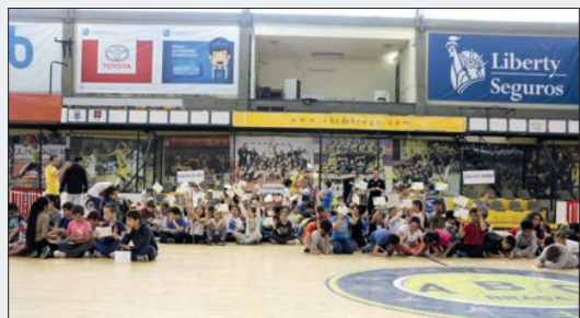
A alegria dos miúdos no Sá Leite