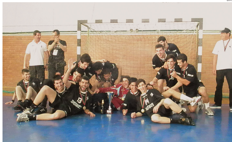
Juniões da Artística de Avanca com a taça de campeões nacionais da 2.ª Divisão

Sempre muito lutadora, a equipa de Aveiro saiu dignifi-