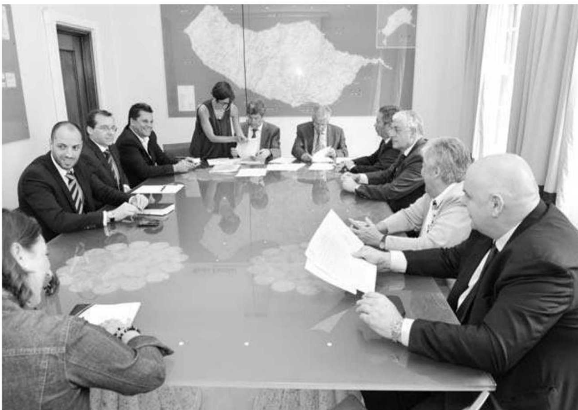
Tribunal de Contas está a averiguar os contratos-programa entre o Governo Regional e as SAD's desportivas.