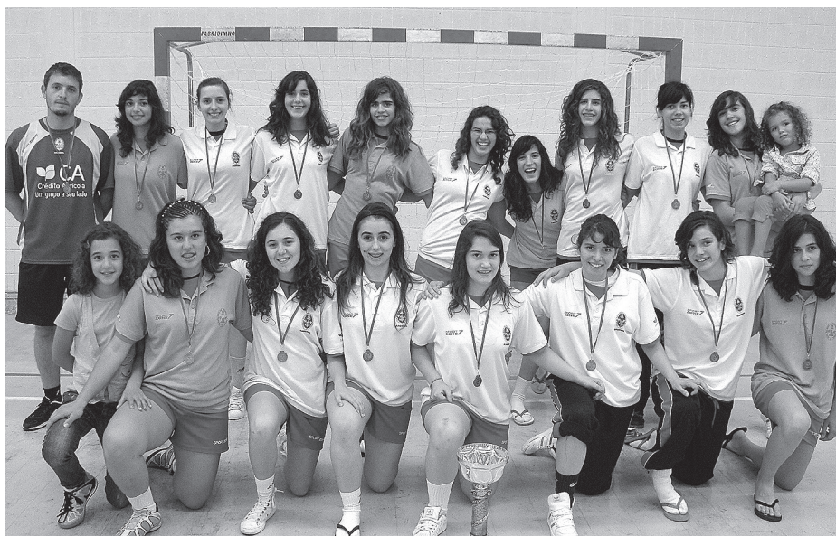
Juvenis femininas da CPVV, vice-campeãs nacionais