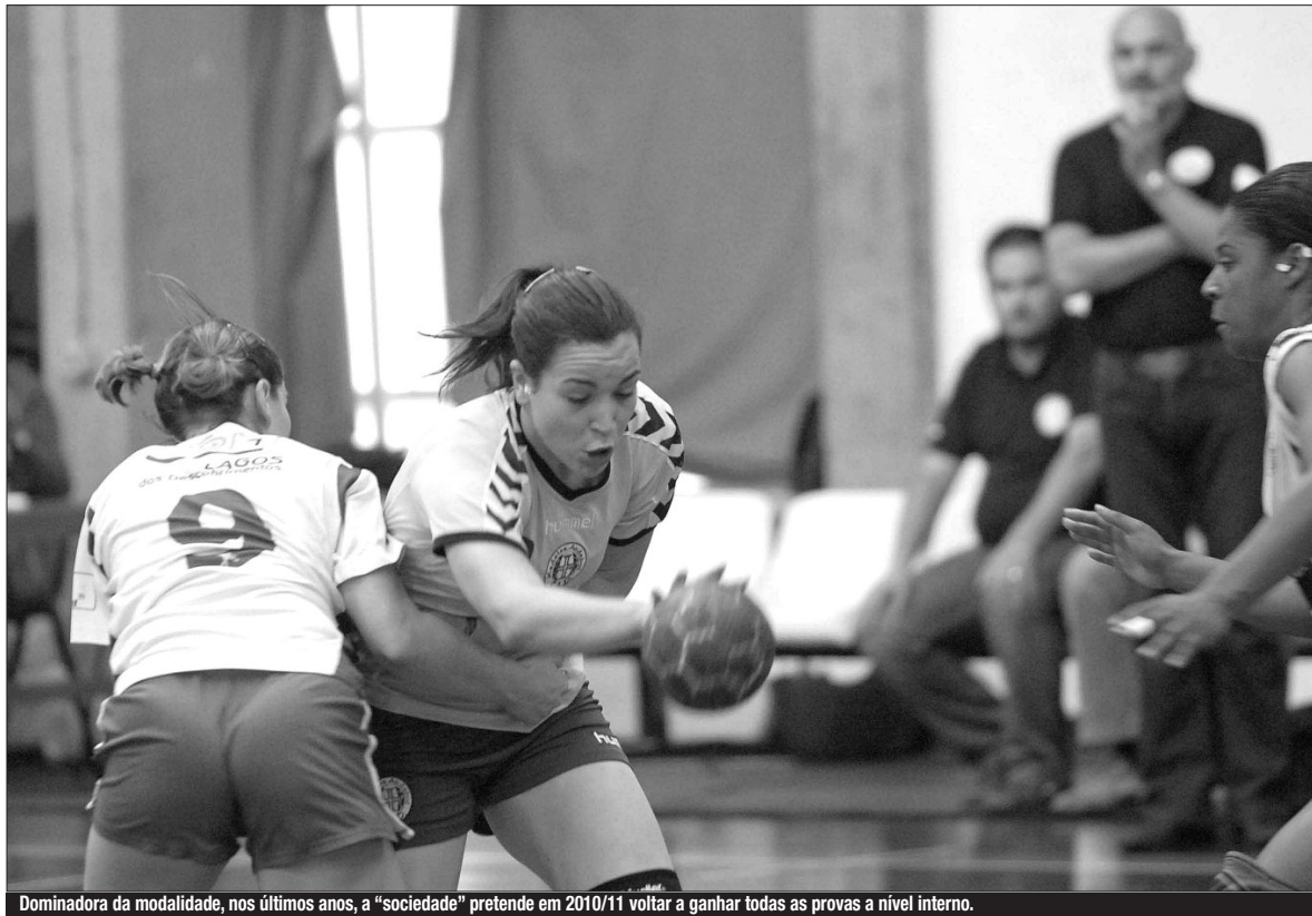
Dominadora da modalidade, nos últimos anos, a "sociedade" pretende em 2010/11 voltar a ganhar todas as provas a nível interno.

■ ANDEBOL - COMPETIÇÃO DESEENROLA-SE, NO FIM-DE-SEMANA, EM COIMBRA