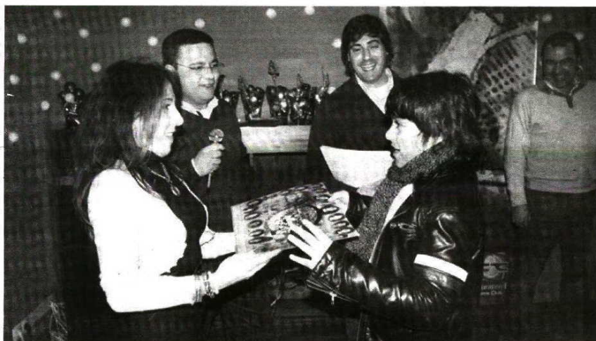
A equipa de infantis de andebol do Sporting Clube de Espinho realizou um jantar de Natal, no restaurante do Complexo de Ténis de Espinho.