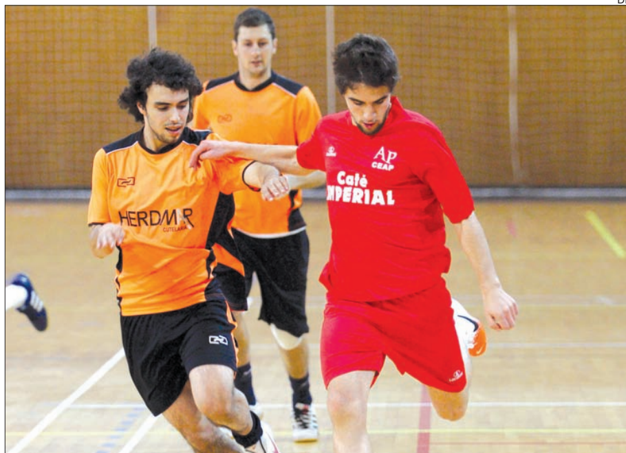
Futsal masculino em acção

O voleibol de praia foi a primeira modalidade a atingir a final do Troféu Reitor, que está a decorrer na Universidade do Minho, e que será disputada pela AFUM e Engenharia Biomédica. Na primeira meia-final foi sem surpresas que a AFUM conseguiu a passagem à final, ao bater MAP-I por 2-0, pelos parciais de 14-21 e 8-21.