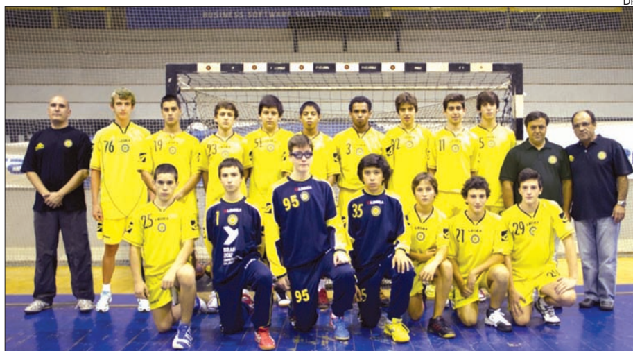
Equipa de iniciados do ABC de Braga

As equipas de iniciados do ABC de Braga e Xico Andebol marcam presença na quarta fase do campeonato nacional da categoria em andebol, que entre hoje e domingo se disputa em Águas Santas,