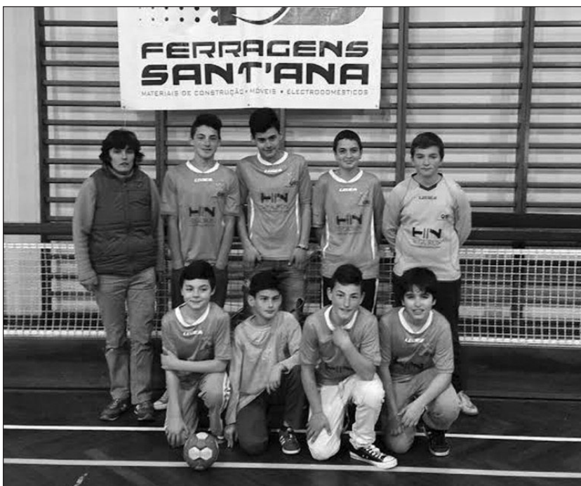
Equipa masculina do Clube Escola de Santana, que jogou em "casa".

Mais uma vez a vitória sorriu ao Madeira SAD por 28-21 fazendo o 2-0 na soma de jogos, ficando então a uma vitória de sagrar-se campeão regional.