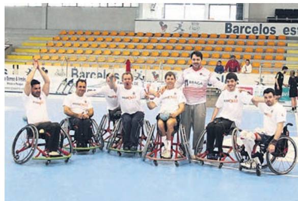
Fase do jogo em basquetebol