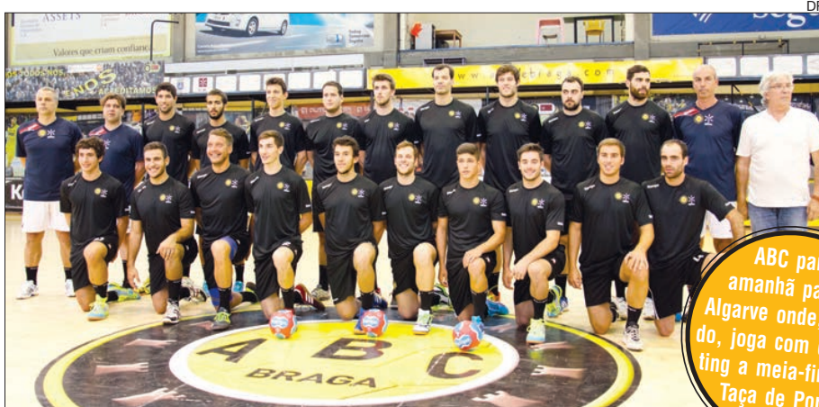
ABC "passa" a Páscoa fora

ABC parte amanhã para o Algarve onde, sábado, joga com o Sporting a meia-final da Taça de Portugal