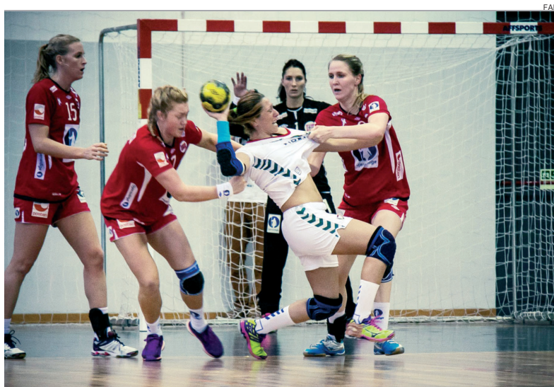
Portugal não conseguiu ultrapassar uma selecção da Noruega muito forte fisicamente

Os primeiros cinco minutos da segunda parte não tiveram golos e foram as nórdicas que reabriram a contagem. Portugal procurava, de todas as formas, contrariar a Noruega, que entretanto controlava o jogo e seguia na frente, mas o conjunto luso - que ainda reduziu até aos três golos de diferença - já não encontrou as melhores