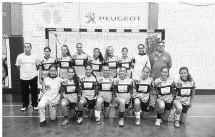
Campeãs regionais de iniciados disputaram a 2.ª fase do Nacional.