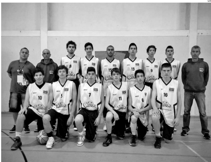
Equipa de basquetebol da Escola Secundária Júlio Dinis, de Ovar, que terminou em segundo lugar

AE Serafim Leite (S. João da Madeira) assegurou o primeiro lugar, enquanto, na Ginástica