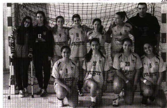
Juniores Femininos do Dom Fugas Roupinho

Na 12ª jornada do Campeonato Nacional de Infantis Masculinos, o Externato Dom Fugas Roupinho foi a Alcobaca vencer o Cister (14-36). ■