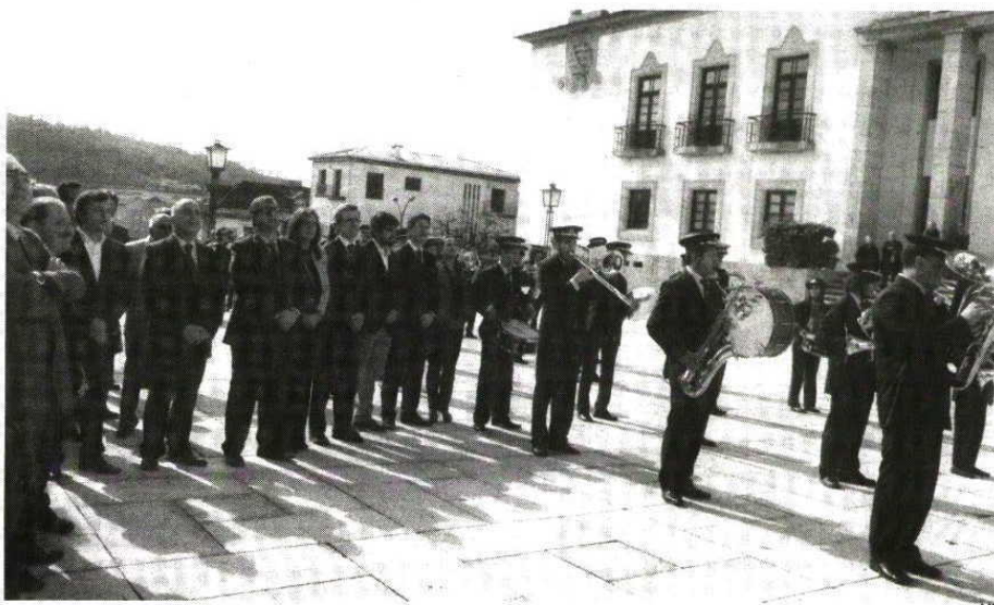
Comemoração do 25 de Abril nos Paços do Concelho da Póvoa de Lanhoso

"Quando se deu o 25 de Abril, eu estava a estudar. Foi a uma Quinta-feira e eu estava numa aula de português. Estes quarenta anos de Liberdade foram positivos para Portugal. Há coisas que podiam ter sido feitas de forma diferente. Espero que estes 40 anos de democracia sirvam de exemplo para as novas gerações. Que seja feito um balanço do que foi bem feito e mal feito pois ainda estamos a tempo de corrigir. Temos um país que tem tudo para dar certo e uma juventude capaz. Nunca poderemos esquecer o passado mas temos que dar um passo em frente, que é pensar no futuro. O futuro depende só de nós, referiu o autarca ao "Correio do Minho".