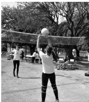
Jovens participam em diversas actividades desportivas

LAMEGO Mais de 400 crianças e jovens, em representação de 16 associações e clubes da região, participaram até ao momento na maior festa de desporto do concelho de Lamego que começou em Março. Pelo nono ano consecutivo, os Jogos Desportivos de Lamego estão a atrair o interesse de todos aqueles que querem praticar exercício físico. O convívio e o fair play também são uma