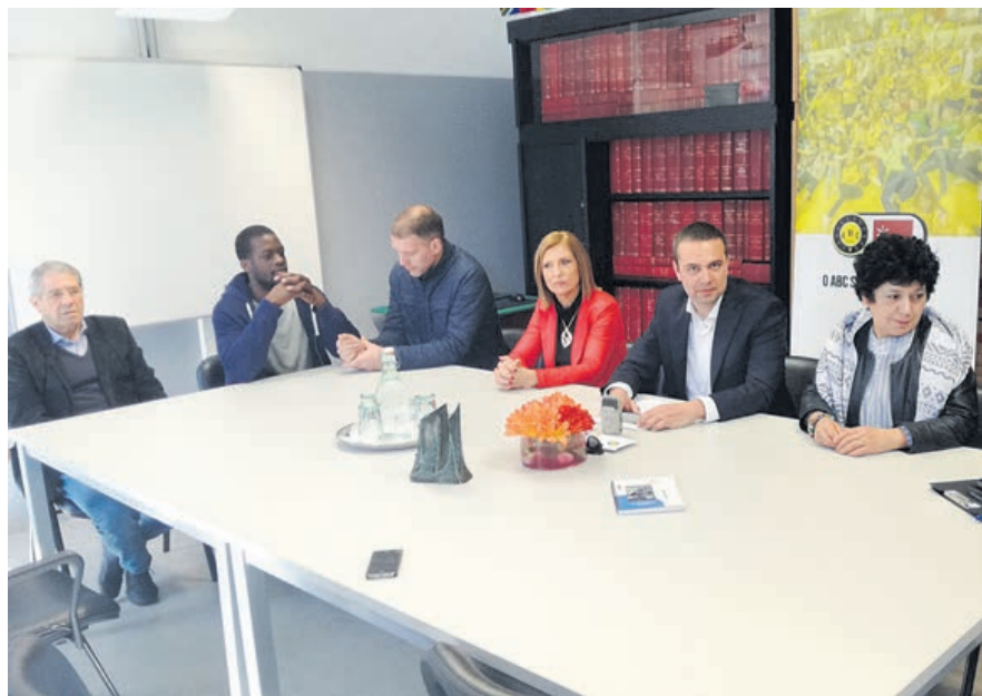
Dirigentes, técnicos e jogadores do ABC, em conjunto com a direcção da escola e a CM Braga apresentaram o protocolo