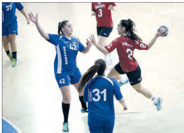
Voleibol da UMinho em ação

O primeiro a entrar “em cena” foi o basquetebol que venceu a terceira partida da fase de grupos e garantiu o primeiro lugar do seu grupo. A vitória por quatro pontos (42-38) sobre o Instituto Superior de Ciências Empresariais