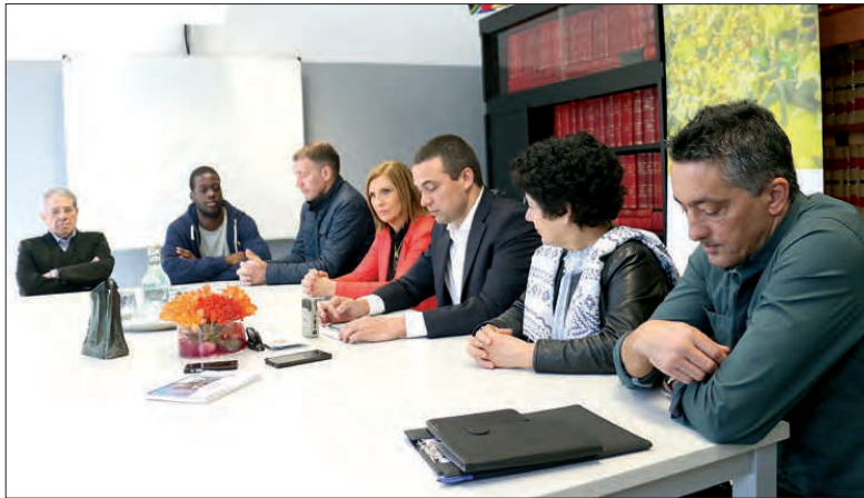
Mesa que ontem apresentou o protocolo entre as instituições