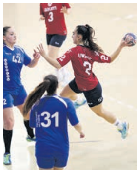
Equipa de andebol feminino da AAUM disputa hoje as meias-finais, já as equipas do futebol e basquetebol os jogos dos 'quartos'

O voleibol, apesar de ter sofrido uma derrota por dois sets a