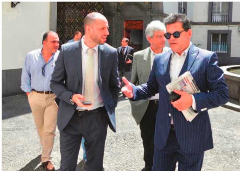
Dirigentes das SAD's estiveram ontem na secretaria da Educação.

"Estamos a entrar no último ano de vigência do PAEF e no fim de uma época desportiva onde não foi possível ao Governo assumir na plenitude em tempo os compromissos com os clubes, fizemos um balanço de tal situação, procurando programar o futuro sabendo que a Região terá no fim deste ano porventura uma alteração de liderança do Governo e do partido que dá corpo ao