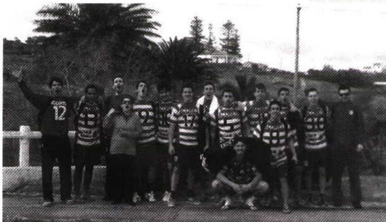
Campeões regionais em Santa Maria

A equipa sénior do Sporting da Horta jogou também no passado