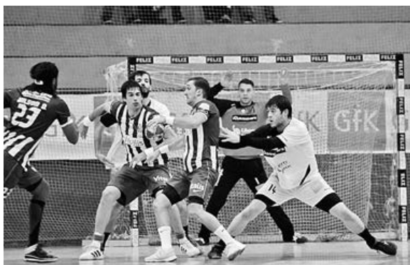
ABC/UMinho esteve mais perto da vitórias nos últimos segundos