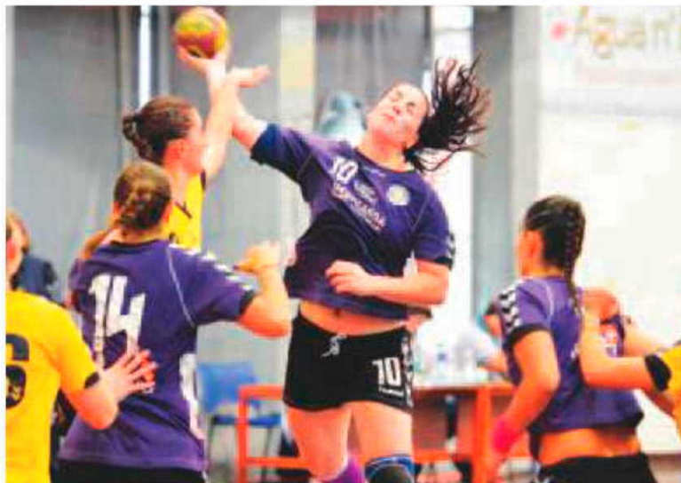
Andebol feminino de novo em destaque.

No entanto, coube ao Madeira Andebol SAD, com alguma naturalidade, assumir o comando do jogo, valendo-se da maior experiência de algumas andebolistas do plantel para contrariar a pressão contrária. As falhas ofensivas do Colégio de Gaia foram quase sempre rentabilizadas pela equipa da Madeira, através de rápidos contra-ataques, ganhando com