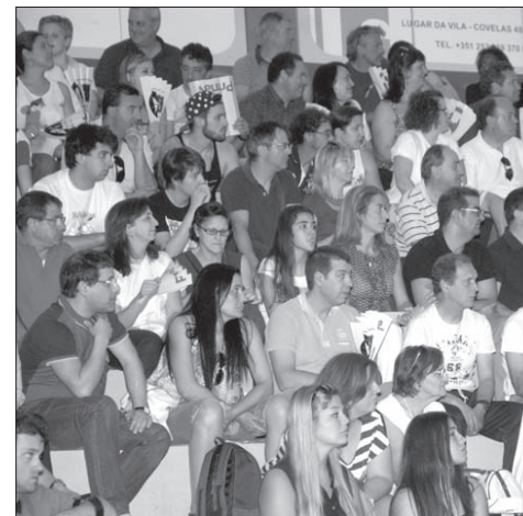
Público do ABC voltou a estar em bom número no Sá Leite

Nós, mais uma vez mostramos que podemos estar à frente ou atrás e dar a volta ao resultado. O FC Porto também. Acho que podemos dizer que hoje (ontem) o FC Porto ganhou um ponto aqui hoje».