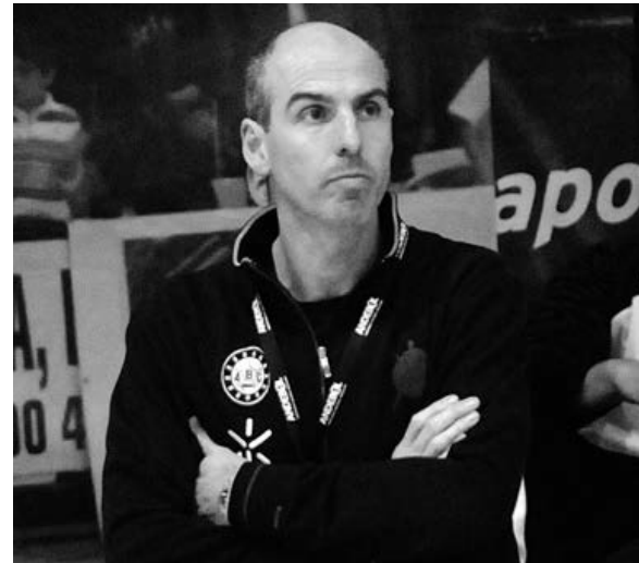
A equipa bracarense ainda acalenta esperanças de chegar ao pódio do campeonato

O encontro entre ABC/UMinho e FC Porto tem início marcado para as 17 horas.