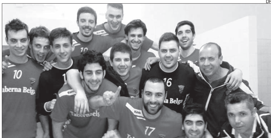
Jogadores do Arsenal da Devesa festejaram a subida de divisão

O Arsenal da Devesa carimbou no passado sábado à noite a subida à II Divisão nacional de andebol ao vencer a Juve Lis, por 25-22, em partida a contar para a 11.ª jorna-