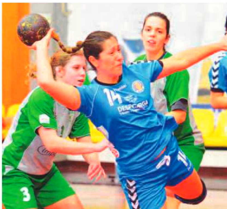
A equipa do Madeira SAD está perto da final.

Ainda no Funchal saliente-se a partida marcada para as 15 horas no Pavilhão do Funchal entre o CCF Madeira e o Benfica, encontro relativo à fase final do campeonato nacional da I Divisão em juvenis masculinos.