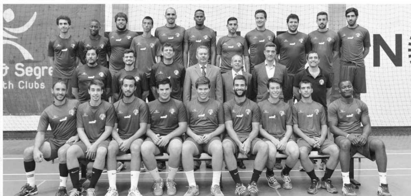
Plantel masculino do Madeira SAD iniciou ontem a nova temporada no Pavilhão do Funchal.

PEDRO FREITAS OLIVEIRA poliveira@dnoticias.pt