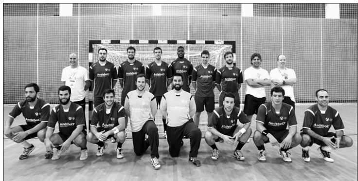
Seleção de andebol da Universidade do Minho

Está dado o "pontapé" de saída no campeonato europeu universitário de andebol 2015. As equipas portuguesas que ontem iniciaram a sua competição podem dizer-se que tiveram uma estreia positiva, se não feito à equipa masculina do Instituto Politécnico de Leiria que neste primeiro encontro cruzou