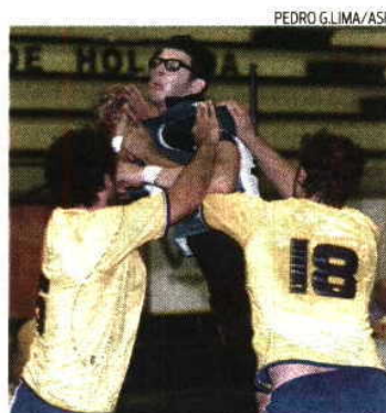
Sporting dominou no Casal Vistoso

O extremo internacional português esteve em destaque na 16. a jornada do Campeonato Nacional, fruto dos 13 golos marcados na vitória do Sporting por 34-21, no último sábado, sobre o Xico Andebol, no pavilhão do Casal Vistoso, em Lisboa, enquanto FC Porto e Águas Santas colocaram um par de jogadores, em resultado das vitórias obtidas sobre o Belenenses (48-29) e ISMAI (30-25), respectivamente, assim como Hugo Rosário da Madeira SAD.