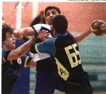
Passos Manuel soma vitória em casa