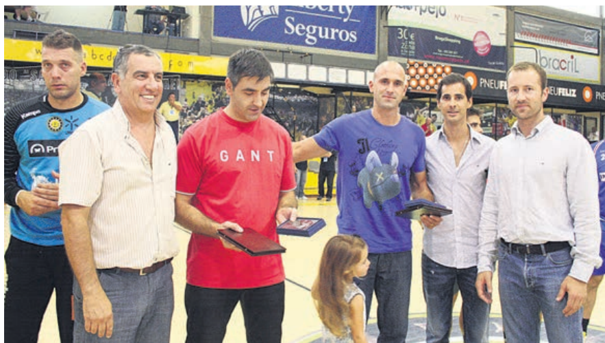
Homenagem a ex-jogadores, sábado passado, no Pavilhão Flávio Sá Leite

Questionado sobre de que forma podeprosseguir na ligação à modalidade, o ex-jogador revela que está a terminar um curso de fisioterapia.