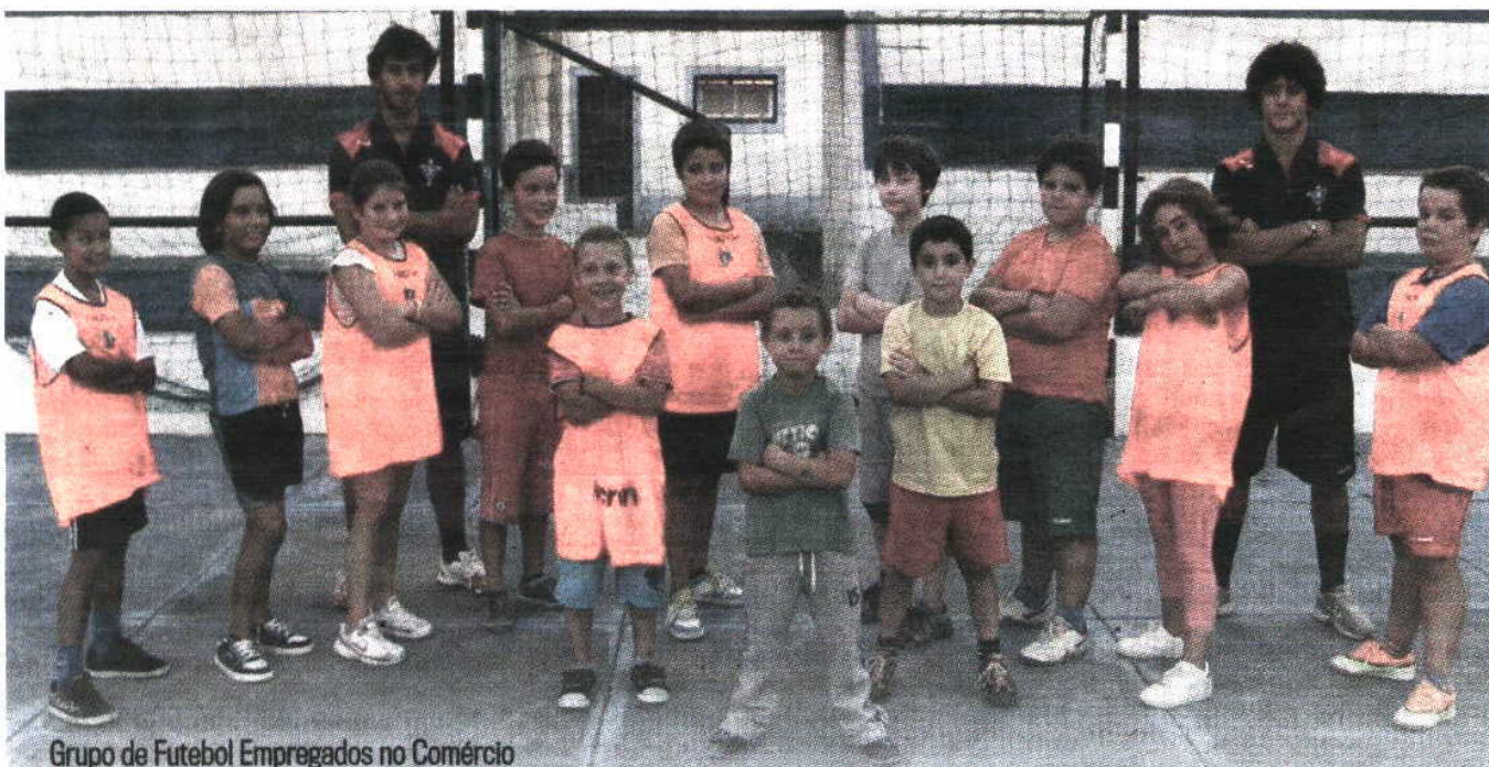
Grupo de Futebol Empregados no Comércio