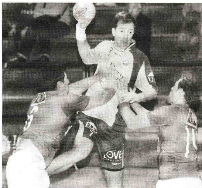
SÃO BERNARDO "regressa" hoje à competição