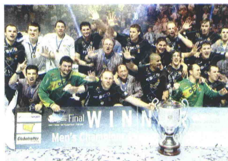
Liga dos Campeões Ciudad Real ganhou as duas últimas

Os açorianos no ano seguinte, também na Taça Challenge. R.G.