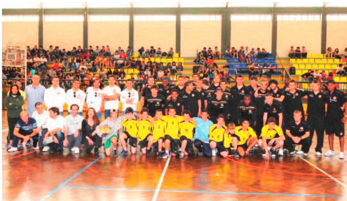
O plantel do Nacional foi recebido em grande festa na escola da 'Levada'.