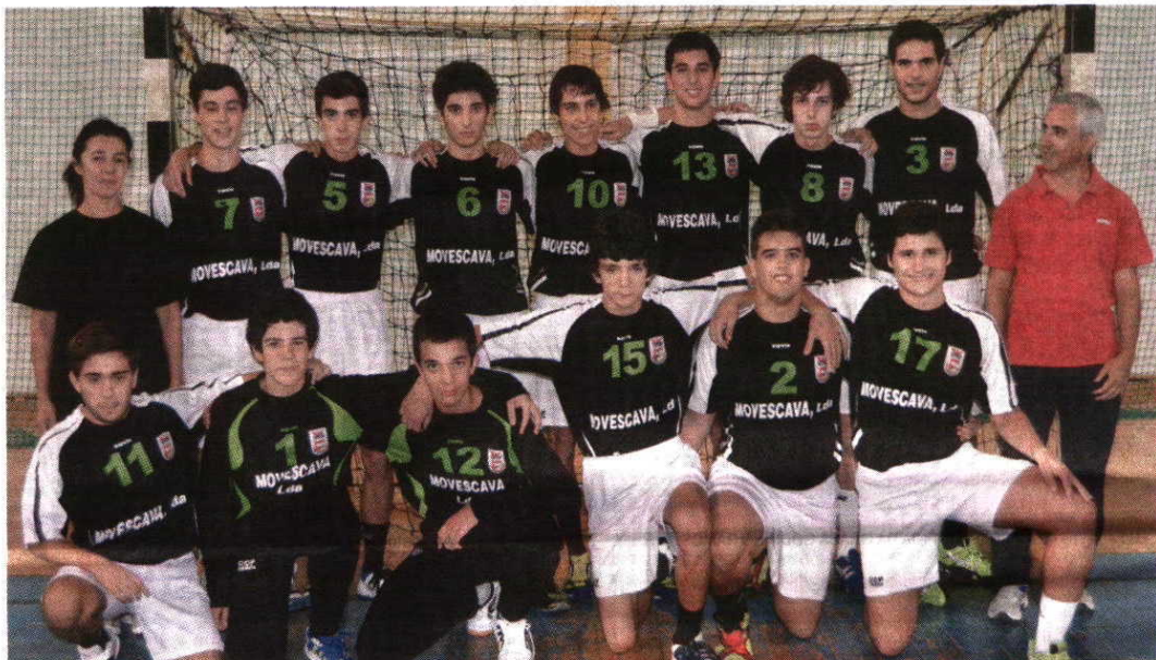
Juvenis Equipa do CCP Serpa que disputa o Nacional de Andebol da 1.ª Divisão

Aqui em Serpa estamos um nível acima, porque jogamos em patamares diferentes, o des-