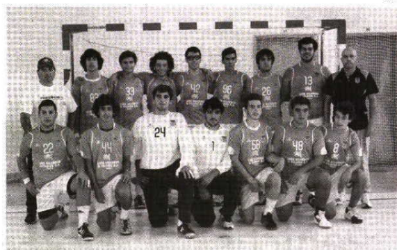
Juvenis Masculinos do Dom Fuas Roupinho ainda não venceram

Em jogo da 2ª ronda do campeonato nacional de Juniores Femininos, zona 4, o Externato Dom Fuas Roupinho recebeu e perdeu com a NAAL Passos Manuel (15-21).