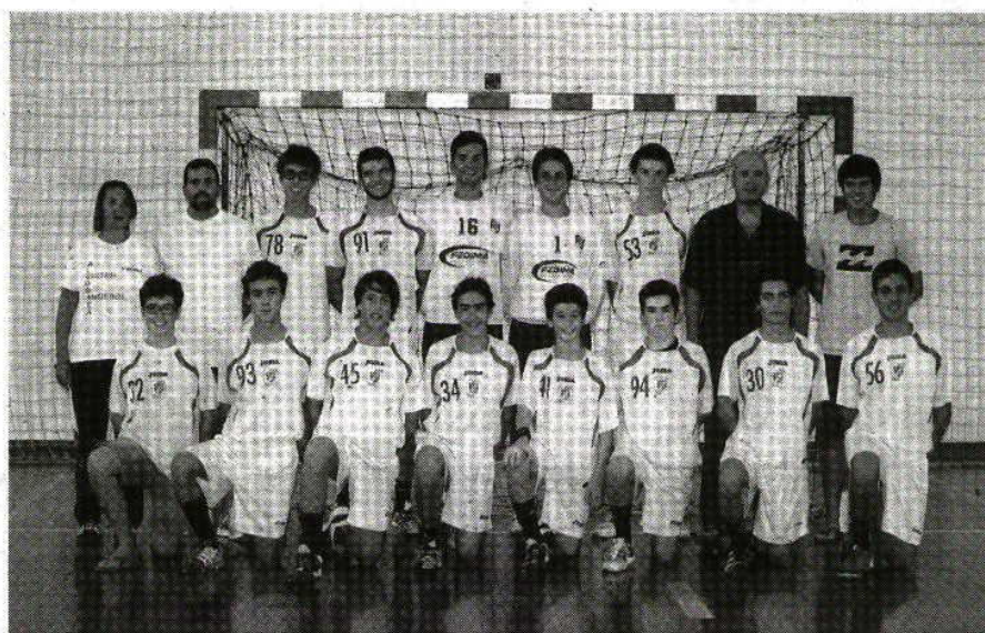
Os juvenis masculinos do Cister Sport de Alcobaça iniciaram oficialmente a época