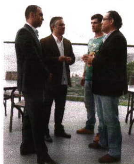
Nazaré foi palco da apresentação da FAP

A Letónia é o primeiro obstáculo e o técnico é claro quanto ao que espera: «Dificuldades. Não há jogos fáceis e este não o será, certamente, apesar de, às vezes, as pessoas não valorizarem estes adversários, que tantos problemas nos tem causado nos últimos anos», recorda. O maior perigo pode chegar na segunda partida, em Sarajevo. «Teoricamente a Bósnia pode ser a equipa que nos causará mais dificuldades. Mas terá de ser em campo que provaremos a superioridade.»