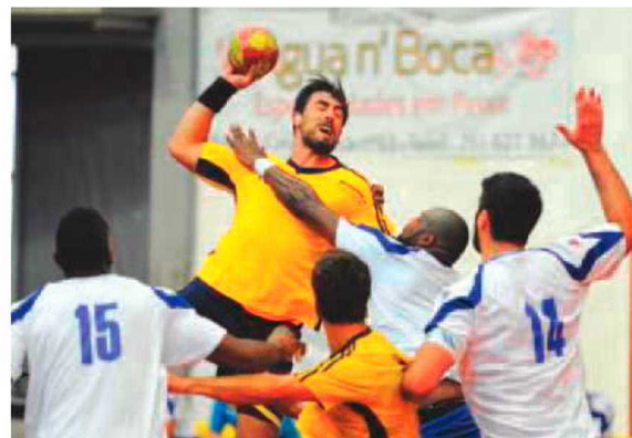
Vitória importante e justa para os madeirenses.