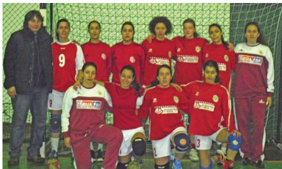
Equipa sénior da Casa do Benfica em Castelo Branco

O objetivo situava-se numa posição entre o 4º e o 5º lugar, atendendo à enorme juventude do grupo, constituído maioritariamente por jogadoras ainda com idade de juvenis. Classificaram-se no quarto posto do seu alinhamento geográfico. “Foi muito