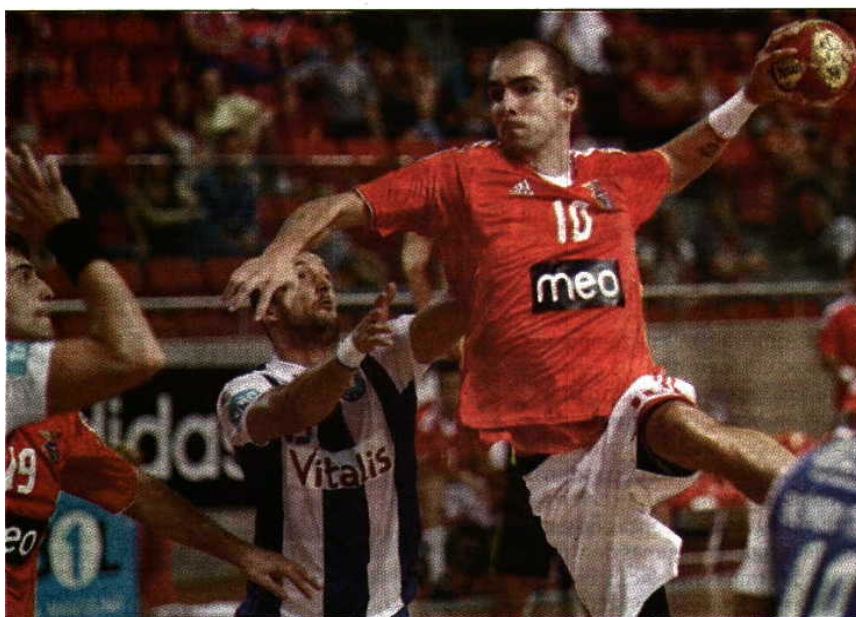
Sem facilitar - Se o FC Porto já é campeão, o Benfica tem de vencer para ser segundo