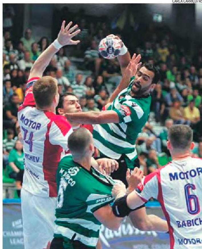
Sporting começou bem mas acabou por não conseguir ultrapassar os poderosos ucranianos

O Sporting estava obrigado a não perder em território ucraniano para manter vivas as esperanças de ainda chegar ao play-off da Liga dos Campeões, mas o desaire por 32-29 terminou com as dúvidas deste grupo D: Montpellier e Motor terminarão nas duas primeiras posições e por isso seguem para a fase eliminatória.