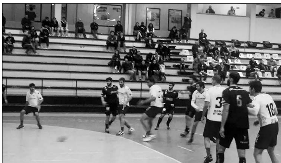
ABC impôs-se no pavilhão do CD Xico Andebol