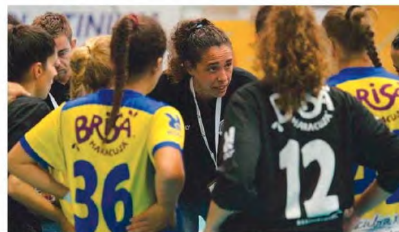
O Madeira Andebol SAD venceu facilmente em casa do Leça.