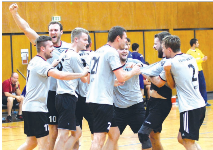
Equipa alemã festeja triunfo sobre a Universidade do Minho

O terceiro dia do campeonato da Europa de andebol que está a decorrer na Universidade do Minho, foi "negro" para as equipas portuguesas.