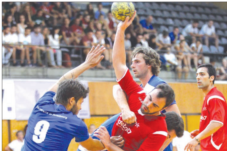
Seleção da UMinho em ação

As formações lusas tiveram sortes diferentes na segunda jornada do europeu de andebol que está a decorrer em Braga. A UMinho (masculina), UPorto e UAveiro (femininas) venceram os seus adversários (22-27), (20-23) e