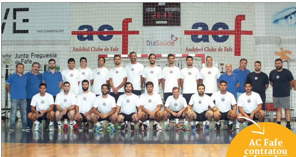
Plantel do AC Fafe para a nova temporada, que ontem começou a trabalhar