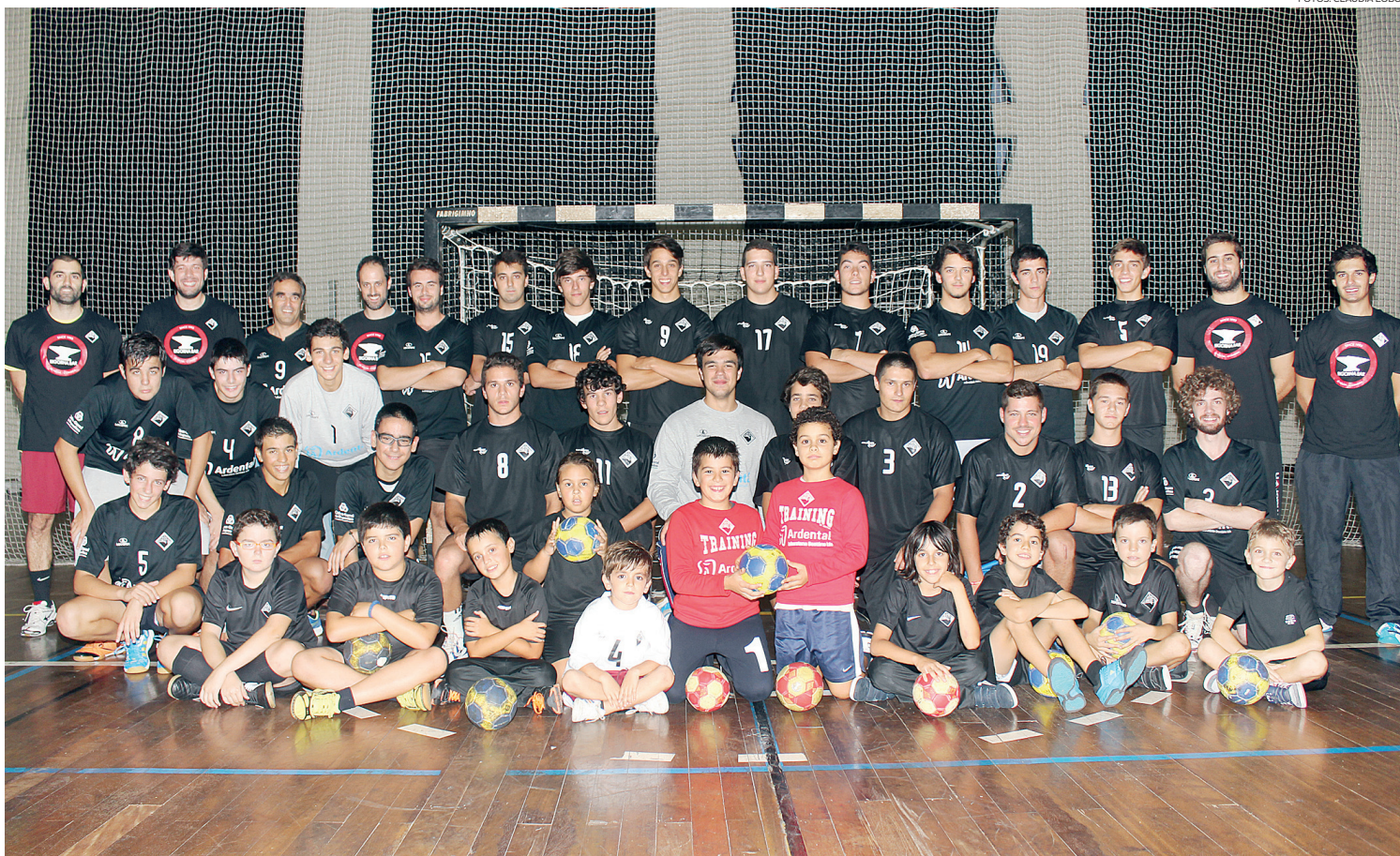
“Família” do andebol academista conta com caras de diversas idades e alegres feições numa secção com grande passado que pretende apostar nos mais jovens para ter um futuro risonho