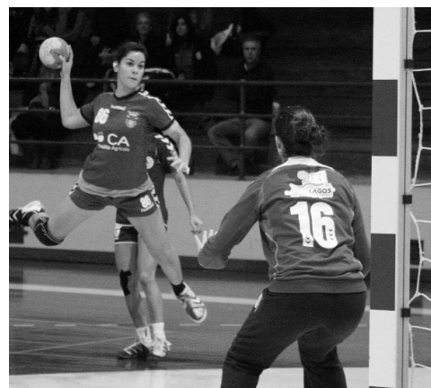
COLÉGIO está em segundo lugar na fase final da 1.ª divisão nacional

A Juve Lis, outra equipa do distrito que disputa a fase final, não jogou no último fim-de-semana, fazendo-o só no próximo sábado com o Colégio João de Barros e, no domingo, contra o Juv. Mar. I