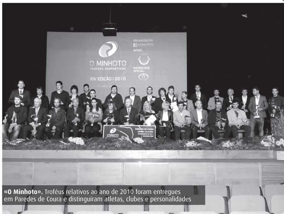
«O Minhoto». Troféus relativos ao ano de 2010 foram entregues em Paredes de Coura e distinguiram atletas, clubes e personalidades

O centro cultural de Paredes de Coura foi palco da cerimónia de entrega dos Troféus Desportivos «O Minhoto», referentes ao ano de 2010.