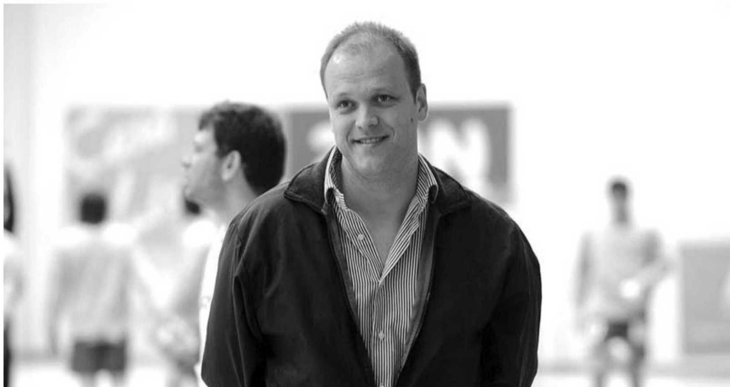
Presidente do Madeira Andebol SAD admitiu que a equipa acabou por ter um sorteio interessante nesta fase final.

De referir que as equipas partem para esta fase final com 50% dos pontos alcançados na primeira fase, pelo que o Madeira SAD parte com 27 pontos, os mesmos que o Benfica e menos três que ABC e FC Porto.