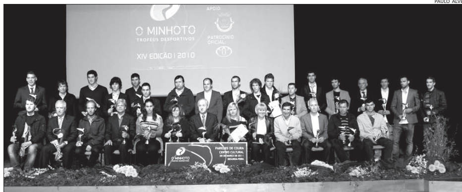
A “foto de família” dos vencedores