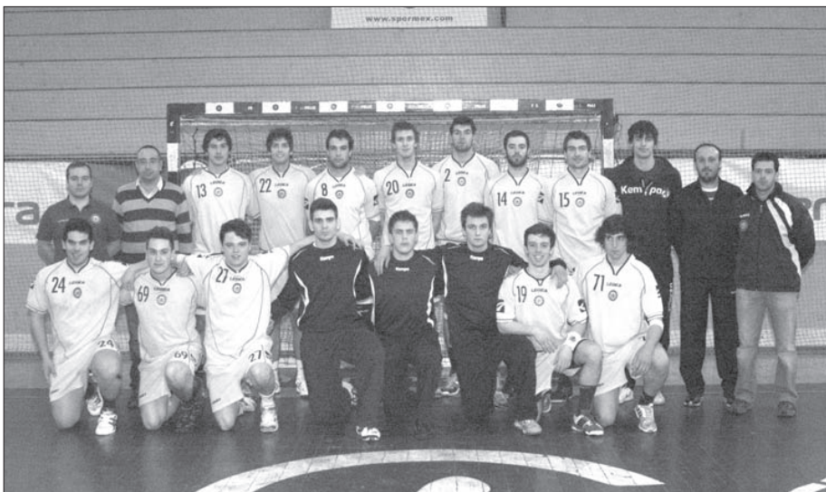
O momento, do sorteio, em que "saiu" o nome do ABC

Na quarta jornada (16 de Maio) o FC Porto visita o Flávio Sá Leite e na quinta é o ABC a jogar no pavilhão do Águas Santas.