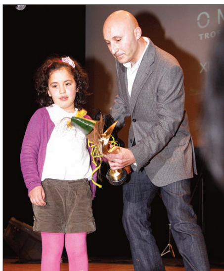
O melhor árbitro foi Cosme Machado