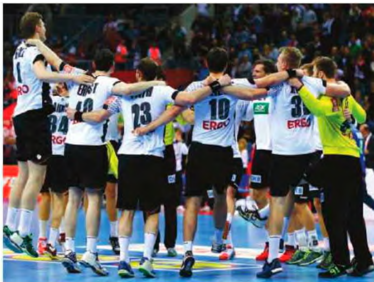
Germânicos em festa após vitória diante da Noruega.