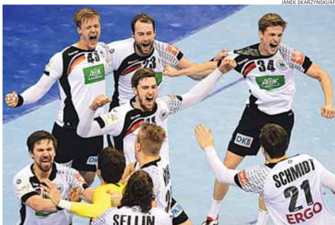
Os jogadores alemães festejam o seu segundo título europeu