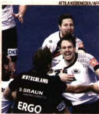
Festa da Alemanha após garantir final