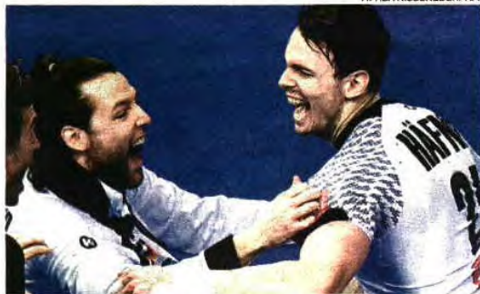
Alemanha e Espanha protagonizam, esta tarde (16.30 h), final inédita do Europeu e a entrada direta nos Jogos Olímpicos do Rio de Janeiro