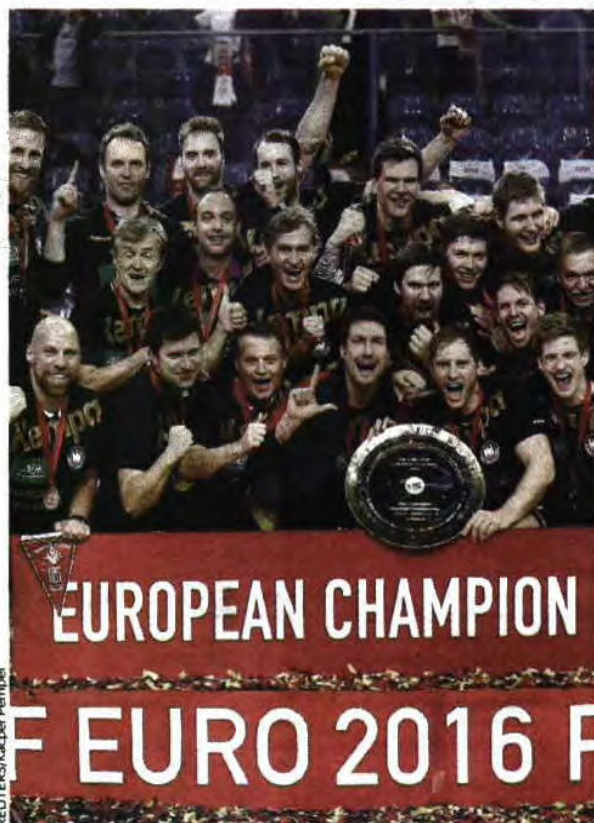
Alemanha foi campeã da Europa pela segunda vez