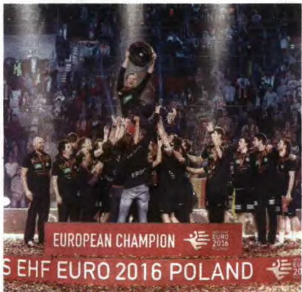
Germânicos celebraram segundo título europeu, na Polónia

Com este triunfo, a Alemanha passou a somar dois Europeus (2004 e 2016), dois Mundiais (1938, 1978 e 2007) e um título olímpico (1936). ●