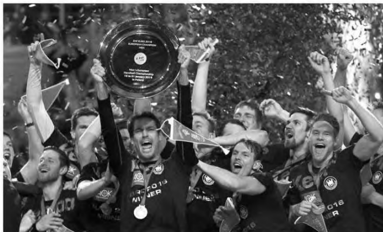
Germânicos bateram na final a Espanha por 24-17.

Já na luta pela medalha de bronze Noruega e Croácia foram as equipas que estiveram também em acção no dia de ontem e com os croatas a serem mais fortes, vencendo por 31-24.