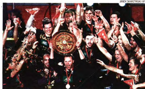
O treinador Islândes Dagur Sigurdsson que levou a Alemanha ao ouro na Polónia

A Espanha nunca conseguiu reagir como lhe era exigido, apesar do esforço de Sterbik na outra baliza, e a Alemanha, que chegou à Polónia sem grandes estrelas — mas com a seleção de sub 21 que, no Egito, em 2009, se sagrou campeã do Mundo — construiu um muro defensivo