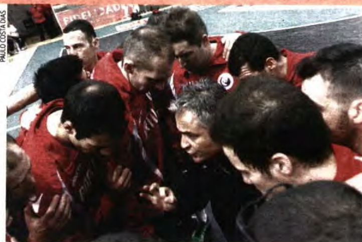
Seleção Nacional não pisa uma fase final desde o Europeu de 2006, na Suíça

E se a Hungria e a Rússia, responsáveis pelo afastamento dos portugueses precisamente do Europeu da Polónia, são de má memória, há menos de um mês, Portugal venceu (32-28) e perdeu (25-26) com a Islândia, o que alimenta a aspiração de um duelo equilibrado, o mesmo acontecendo com Bielorrússia (18.ª no Mun-