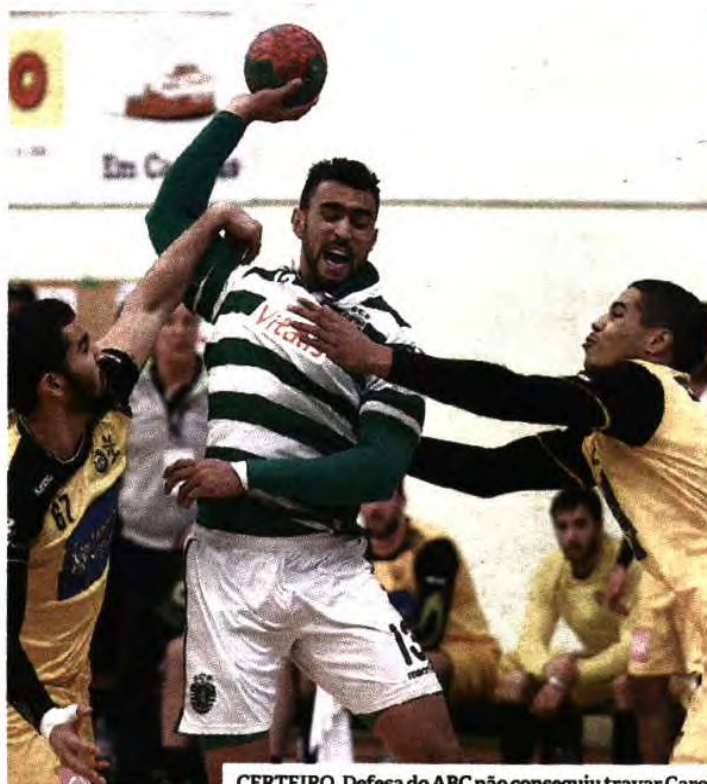
CERTEIRO. Defesa do ABC não conseguiu travar Carol

“É assim que quero o Sporting a jogar, com muita intensidade e