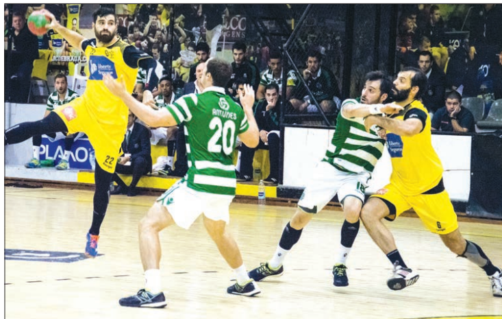
ABC afastado da luta por troféu que conquistou na temporada passada

O ABC foi ontem, afastado da Taça de Portugal de andebol ao ser goleado por 38-24 no pavilhão do Sporting, em partida dos oitavos de final da competição.