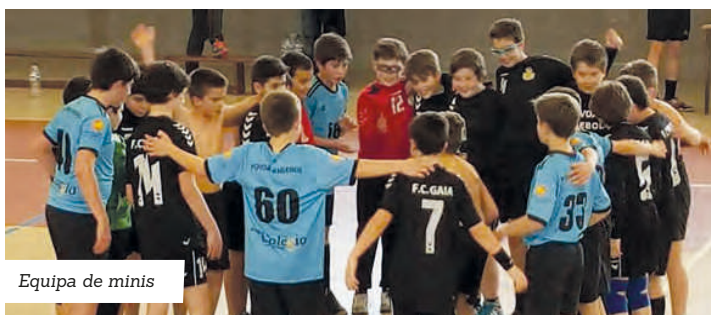
Equipa de minis

No próximo fim de semana os jogos prosseguem. Sábado, às 15h30, os infantis do Póvoa Andebol recebem o Leça, no pavilhão da Escola de Beiriz. Às 18h a equipa de juvenis desloca-se ao pavilhão do Colégio Universal. Para domingo estão marcadas as partidas entre minis, frente ao Águas Santas, às 9h30, e iniciados no ISMAI, às 12h.