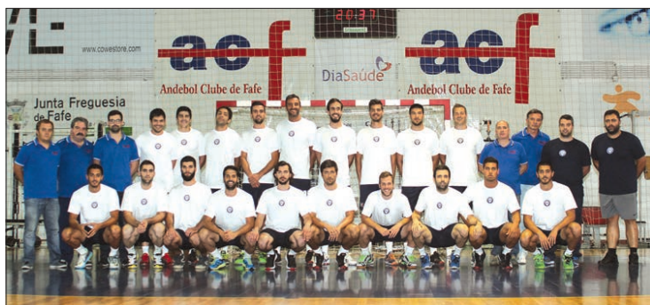
AC Fafe venceu mas terá de repetir o jogo, que se vai realizar no próximo dia 9