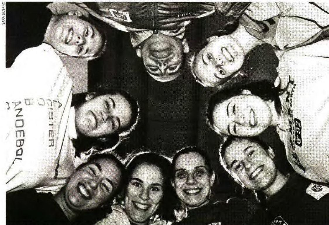
A atual formação da equipa feminina do Cister Sport de Alcobaça começou a trabalhar junta em 2015

No próximo dia 4 de março, sexta-feira, pelas 21h00, realiza-se no pavilhão D. Pedro I em Alcobaça, um jogo de Andebol relativo aos 1/8 de final da Taça de Portugal Multicare em Seniores Femininos, entre a equipa local do Cister Sport de Alcobaça e a equipa visitante do Madeira SAD, atual detentor do troféu e uma das potências nacionais na modalidade.