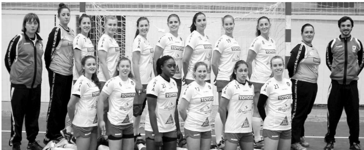
Uma equipa talentosa que dá tudo em prol da equipa e do andebol