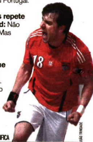
*JOGADOR DE ANDEBOL DO BENFICA

Um livro que aconselha: Só li um livro. Foi o primeiro livro de José Mourinho e valeu muito a pena.