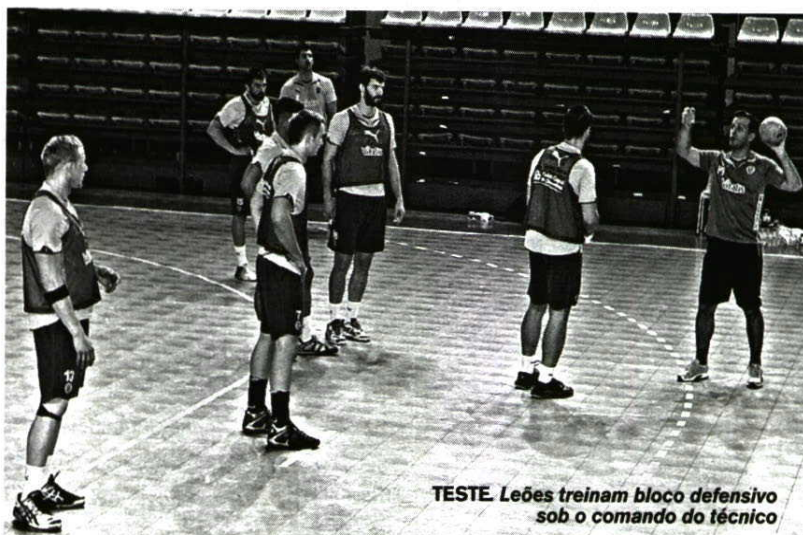
TESTE. Leões treinam bloco defensivo sob o comando do técnico

Início forte. O técnico disse que a equipa tentará entrar forte como na 1.ª mão, para controlar a eliminatória e a marcha do marcador: “Não podemos pensar que a tarefa está facilitada. Temos qualidade, mas os polacos também. Vamos lutar para vencer, custe o que custar, mas nada está garantido. Esperamos que os cerca de três mil adeptos aumentem a nossa força para vencermos a Taça Challenge”, pediu Faria para o duelo, que será arbitrado pelos croatas Vjekoslav Lovric e Hrvoje Petkovic.