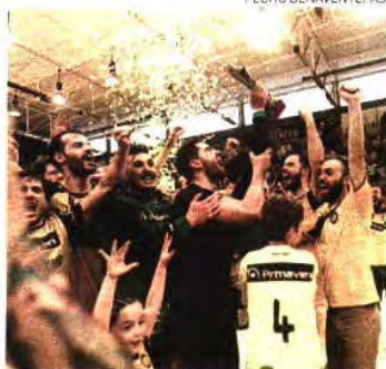
ABC venceu Nacional e Taça Challenge