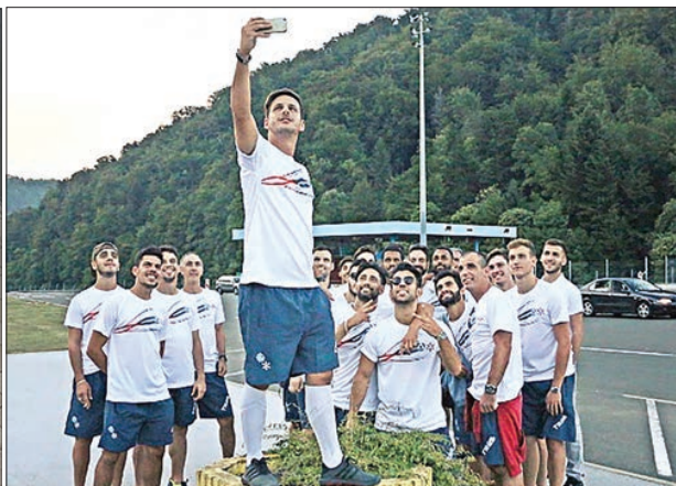
Equipas de andebol e futebol da UMinho