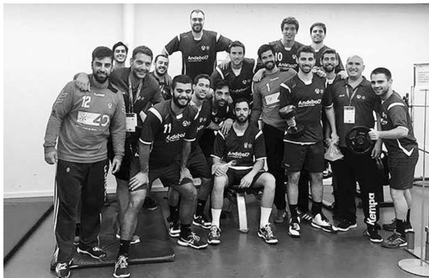
Equipa de andebol da Universidade do Minho em competição no EUSA Games

Foi uma partida intensa e equilibrada, mas na qual os minhotos se mostraram ao seu melhor nível, isto apesar de alguns contra-ataques falhados. No final, a vitória por 29-26 frente ao