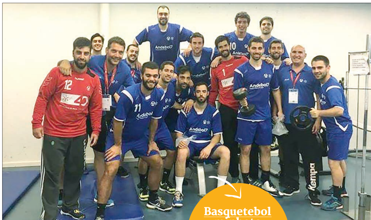
Equipa de andebol da Universidade do Minho

O andebol masculino da UMinho somou a sua primeira vitória nestes EUSA Games após vencer por 29-26 a equipa da Universidade de Ljubljana (Eslovénia). O basquetebol somou mais duas derrotas e disse adeus aos quartos de final.