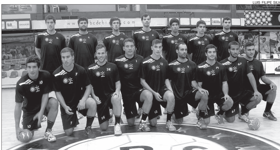
Plantel do ABC/UMinho no primeiro dia da nova temporada