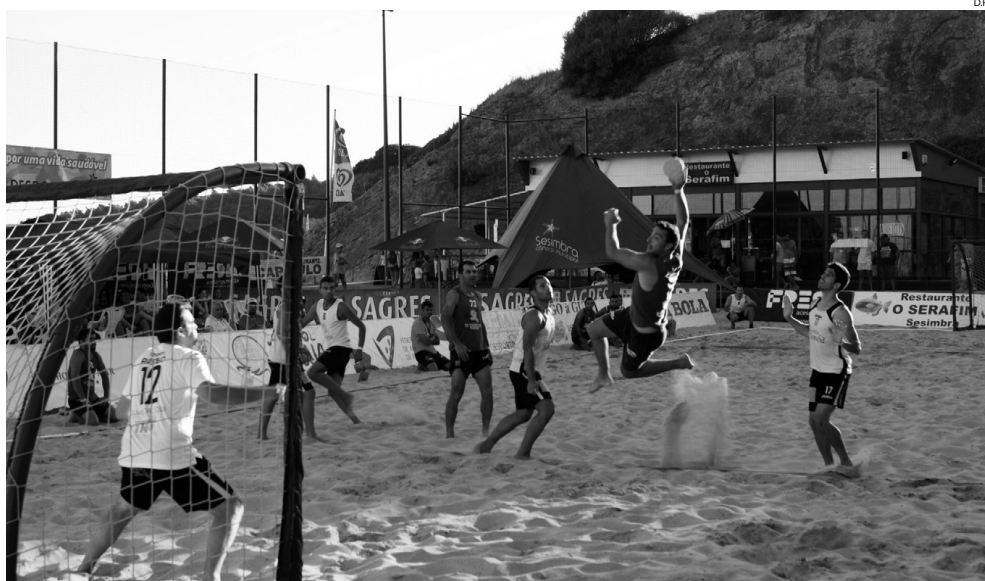
Modalidade proporciona momentos de grande espectacularidade, com várias piruetas e grandes defesas