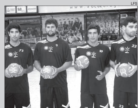
Os quatro reforços do clube para 2013/2014