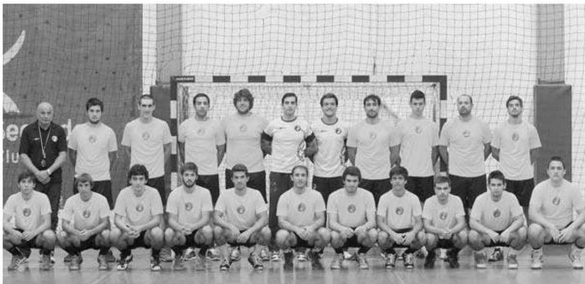
O plantel do Madeira Andebol SAD apresentou-se ontem trabalho.