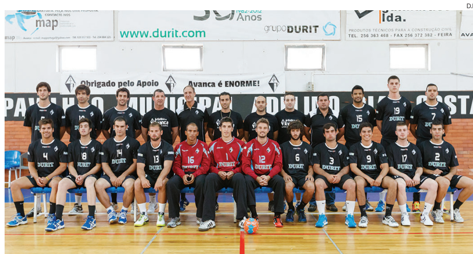
Grupo que marcou presença no arranque dos trabalhos da Artística de Avanca

Andebol O arranque da época, na qual o clube de Avanca vai voltar a competir na 1.ª Divisão Nacional, contou com cinco “caras novas”. O plantel ainda não está fechado