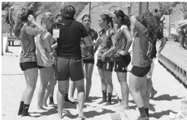
Verde-rubras estrearam nos Nacionais da modalidade.

Quanto ao campeão feminino veio a ser o 'As 100 Ondas' que na final viriam a vencer os 'Z'Imbo-ra' por 2-0, enquanto o 'N8.N80' conquistou o bronze. P. V. L.