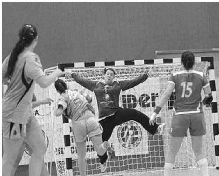
Guarda-redes madeirense já foi por duas vezes a melhor jogadora lusa.