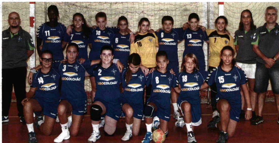
VONTADE. A equipa de iniciadas femininas dos "Caixeiros" já mostraram que o trabalho feito nos últimos dois anos deu resultado