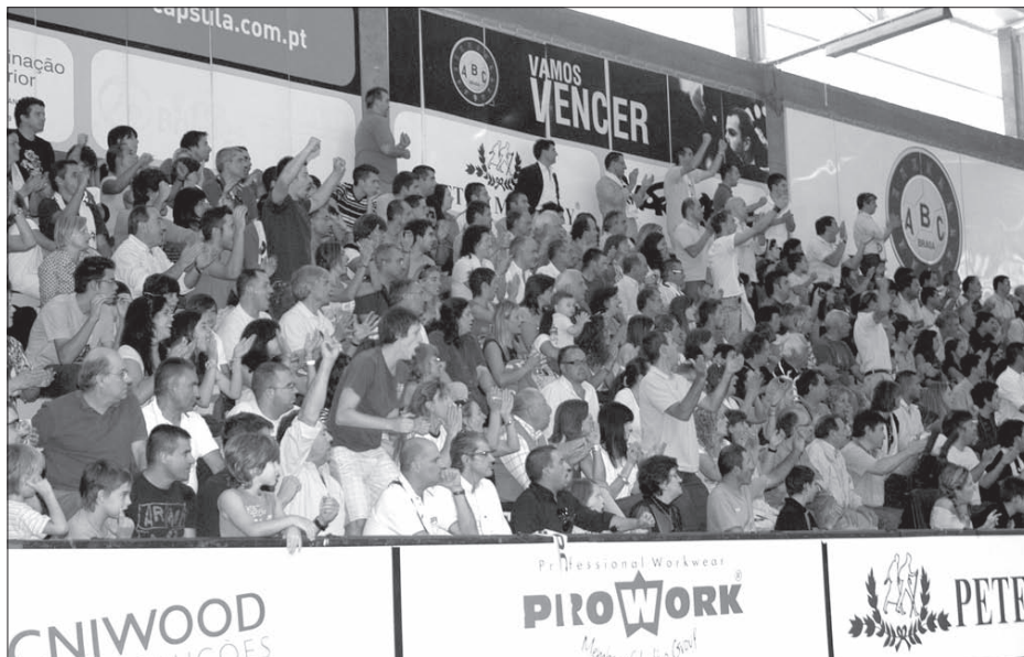
Público do ABC quase encheu o Flávio Sá Leite