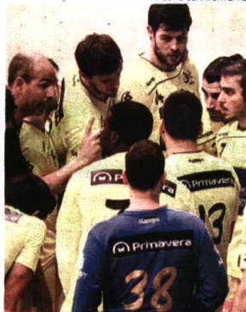
ABC persegue feito histórico

Esta é a terceira tentativa dos academistas de igualar o feito do Sporting que, em 2010, conquistou a Taça Challenge, e é, até esta época, a única equipa portuguesa a conseguir alcançar tal feito.