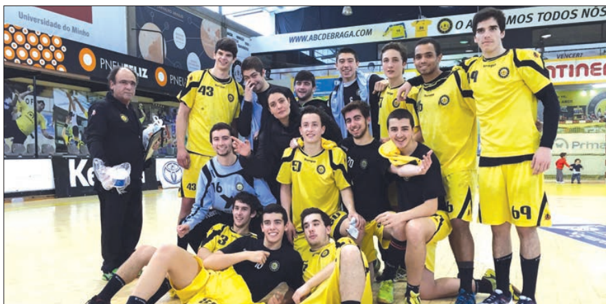
ABC está na luta pelo título nacional

A equipa de juvenis do ABC garantiu, ontem, a respetiva presença na fase final do campeonato nacional da categoria, ao terminar em primeiro lugar a fase de apuramento disputada no Pavilhão Flávio Sá Leite.