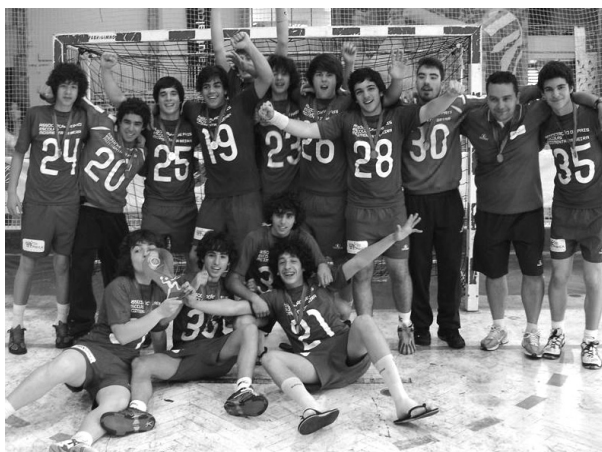
Os 'mundialistas' que levam o nome de Moimenta Beira ao plano Mundial

A conquista do título coloca a formação moimentense como a representante de Portugal no Campeonato Mundial da modalidade, que decorrerá em Lisboa de 5 a 7 de Julho.