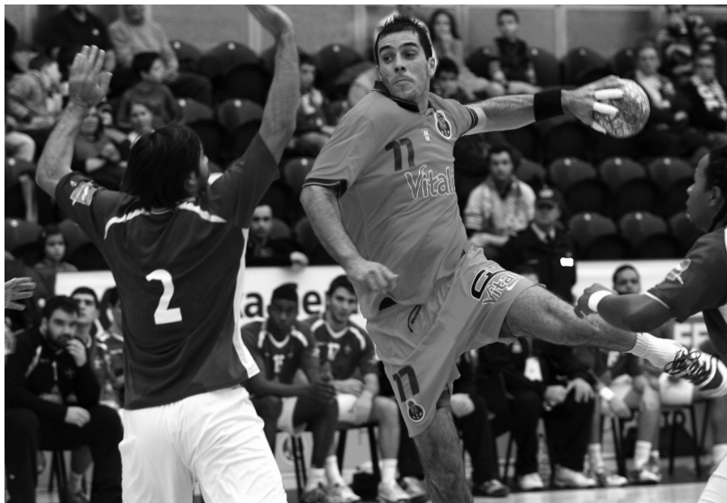
Tavira. FC Porto quer conquistar a dobradinha e para isso tem de vencer amanhã o Benfica nas «meias» da Taça

Questionado se este poderá ser o jogo entre as duas melhores equipas do Campeonato, o «universal» do FC Porto foi peremptório: “O FC Porto Vitalis é seguramente a melhor, pois é o Campeão; quanto ao Benfica, não tenho tanta certeza,