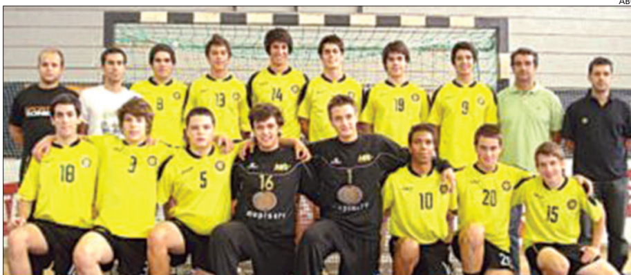
Juvenis do ABC de Braga, procuram, no Sá Leite, terceiro título consecutivo

De resto, os jovens academistas conquistaram seis tro-