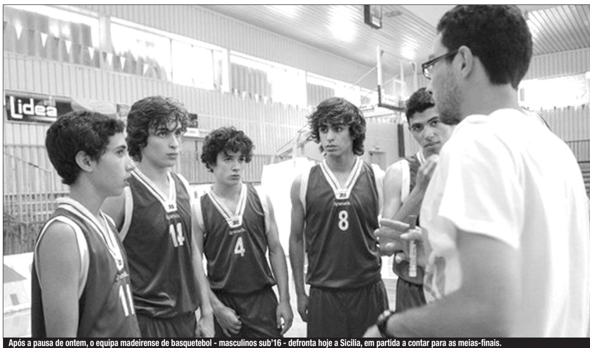
Após a pausa de ontem, o equipa madeirense de basquetebol - masculinos sub'16 - defronta hoje a Sicília, em partida a contar para as meias-finais.

Em dia de pausa na competição em algumas modalidades nos Jogos das Ilhas, que decorrem na Sicília, os jovens viveram uma jornada mais de âmbito cultural e de lazer, na forma de um passeio. Reforçaram-se, então, os laços de amizade entre os participantes.