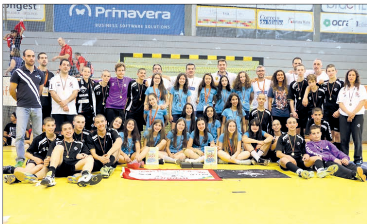
As duas equipas vencedoras e os respetivos padrinhos da prova que se realizou em Braga