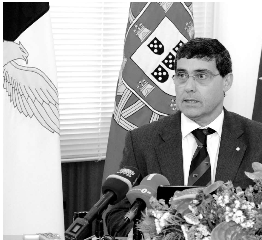
DIRETOR REGIONAL DO DESPORTO enaltece evolução sustentada do desporto açoriano