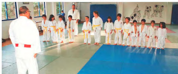
O judo tem escalões de formação e de competição

Neste momento e, pela segunda vez consecutiva, decorre o torneio de futsal João Paulo Cristo com jogos todos os sábados até 18 de junho e cuja final será disputada