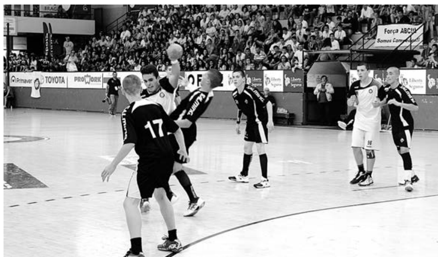
Jogo da final entre ABC e Águas Santas em masculinos

Assim, o AA Águas Santas leva para casa a Medalha de Ouro do Encontro Nacional de Infantis e o ABC, a de prata. Em femi-