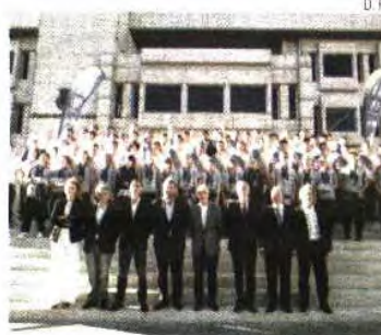
Águas Santas recebido na Mala

A autarquia da Mala recebeu e homenageou os escalões de juvenis, iniciados (ambos campeões nacionais) e infantis (vencedores do Encontro Nacional) do Águas Santas pelas performances alcançadas na época 2015/2016.