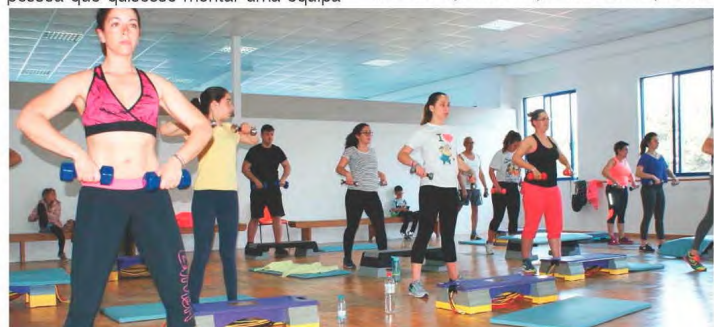
Global Fitness é uma das ofertas deste clube

O clube é composto por três secções: futebol e judo de formação e competição; uma escola de música com uma banda fi-