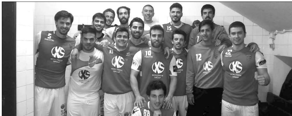
Arsenal da Devesa venceu S. Mamede e festejou a subida à I Divisão nacional

A já mencionada «estabilidade» que Carlos Saraiva pretende emprestar ao Arsenal da Devesa nesta nova e inédita realidade, onde vai defrontar alguns opositores de luxo do panorama nacional – Benfi-